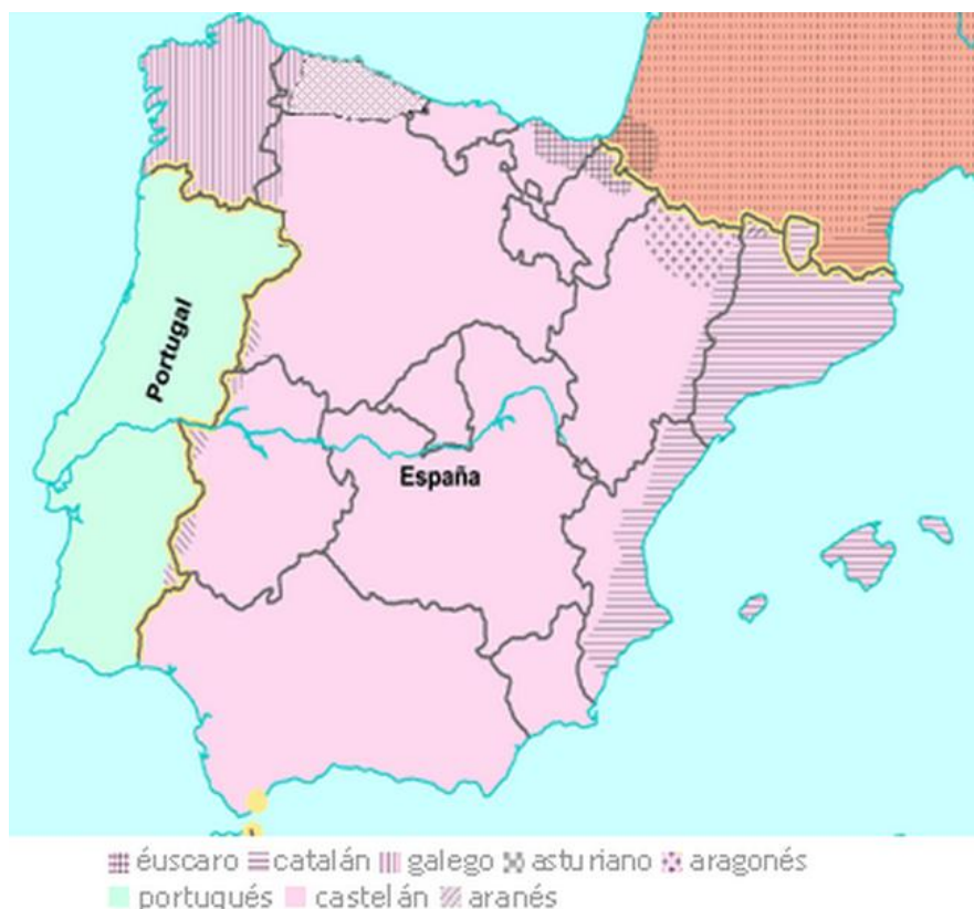
Figura II: Linguas da Península Ibérica. CCG (9) .

En España, a realidade lingüística é rica e plural ( Figura II (9) ). Ademais do castelán, a lingua oficial en todo o territorio, hai tres linguas máis cun estatus de cooficialidade nas comunidades autónomas nas que se falan. Son o euskera, o catalán e o galego. A isto debemos engadirle outras linguas que contan cunha protección legal menor, como son o asturiano, o aragonés e o aranés. Ademais, nas Illas Baleares falan catalán e, en Valencia, o valenciano.