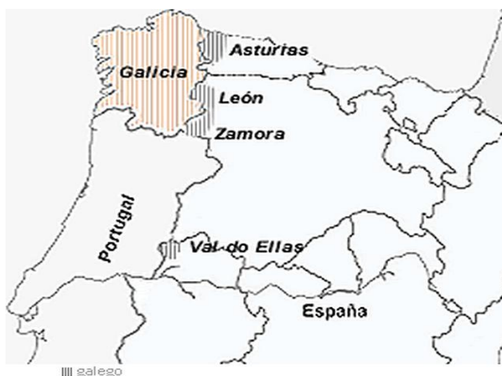
Figura III: Localización territorial da lingua galega. CCG (10)

A realidade das linguas normalmente transcende as fronteiras administrativas, polo que o galego se fala en áreas que quedan fóra do territorio da Comunidade Autónoma de Galicia. Nas áreas máis occidentais das provincias de León e Zamora e en parte de Asturias hai núcleos de falantes habituais de galego, así como no Val do Ellas, en Estremadura ( Figura III (10) ).