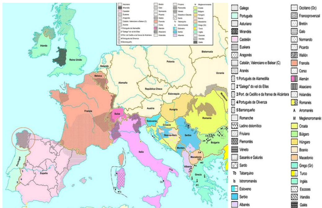
Figura 1: Mapa das linguas en Europa. Consello da Cultura Galega (3) .

Na Unión Europea fálanse moitas máis linguas das que son consideradas oficiais (unhas 23 linguas oficiais, ¡Error! No se encuentra el origen de la referencia. (3) ). Podemos entón facer referencia a varias situacións: países cunha única lingua oficial (os máis numerosos); países oficialmente bilingües, trilingües etc; e países con varias rexións lingüísticas ou linguas cooficiais (España, Finlandia, Suíza etc).