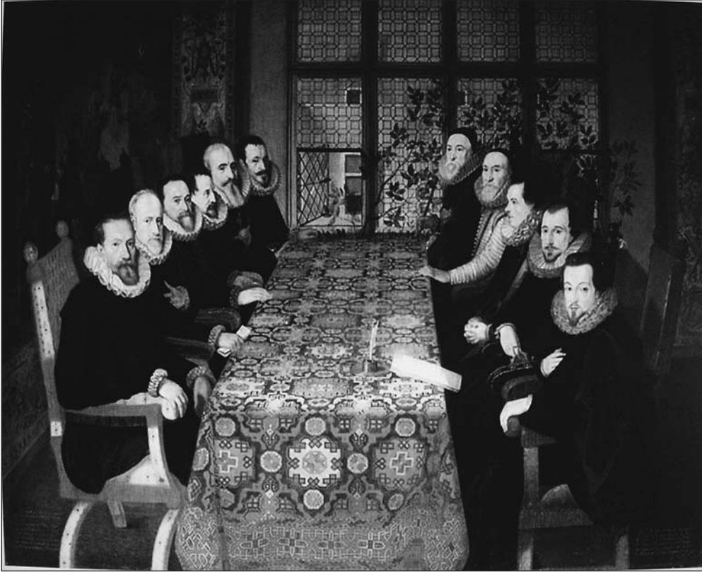
Fig. 4.-The Somerset House Conference, agosto 1604. Anónimo, National Portrait Gallery Londres.