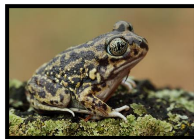
Figura 1. Ejemplar de Pelobates cultripes .

El sapo de espuelas, Pelobates cultripes (Cuvier, 1829), es un anfibio anuro perteneciente a la familia Pelobatidae. Esta familia, que conserva caracteres relativamente primitivos (Vitt & Caldwell, 2009), se caracteriza por presentar individuos de tamaño medio (50-80 mm de longitud), aspecto rechoncho y pesado y piel suave aunque tenga verrugas (García-París et al. , 2004; Vitt & Caldwell, 2009). A los individuos de esta familia se les denomina comúnmente como “sapos de espuelas” debido a su desarrollado tubérculo metatarsal, situado en el borde exterior de cada pata trasera (Poug et al. 1998; García-París et al. , 2004; Vitt & Caldwell, 2009). Dentro de esta familia encontramos la subfamilia Pelobatinae, que incluye cuatro especies agrupadas en un único género, Pelobates , contando con un único representante en la península ibérica: Pelobates cultripes (Lizana, 1997a, 1997b; García-París et al. , 2004).