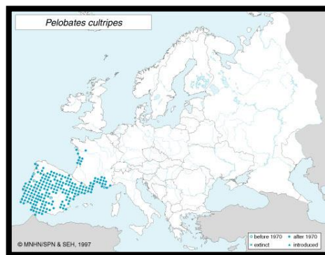
Figura 4. Distribución de Pelobates cultripes en Europa (Lizana, 2007a).

Su distribución geográfica mundial se limita exclusivamente a la Península Ibérica (España y Portugal) y a las costas mediterránea y atlántica de Francia (Fig.4; Lizana, 1997a, 197b; Tejado & Reques, 2002; Thirion et al. , 2002;García-Paris et al. , 2004; Thirion, 2004, 2006; Cruz, 2008; Matos, 2012; Thirion & Cheylan, 2012; Sillero et al. , 2014). En la Península ibérica (Fig. 2) está ampliamente distribuido por gran parte del territorio (Rey-Muñiz, 2013), estando ausente en el cuadrante sudoriental, la franja cantábrica, así como en los Pirineos centrales y occidentales (Recuero, 2014); y extinto en Gibraltar (IUCN, 2009).