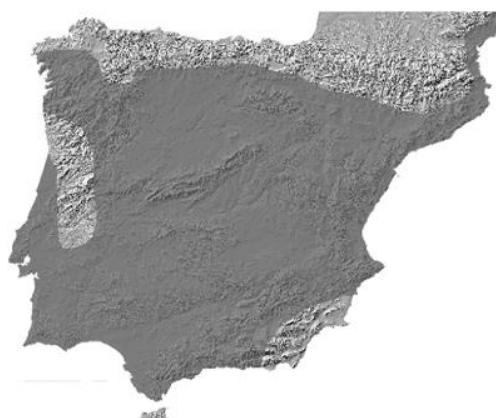
Figura 2. Mapa de distribución de Pelobates cultripes en la península ibérica (Recuero, 2014).

Pelobates cultripes es un sapo de apariencia robusta, con la piel lisa o poco verrugosa. Presenta una coloración dorsal variable, gris, pardo clara o verdosa, con manchas más oscuras formando moteados o jaspeados; mientras que la zona ventral es blanquecina o color crema con un moteado oscuro difuso (no siempre). Posee un tubérculo metatarsal interno grande, de color negro en forma de uña de consistencia dura (la “espuela”, de ahí su nombre). Sus ojos presentan una pupila vertical con el iris de color dorado o verde amarillento, con reflejos metálicos y líneas sinuosas negras. El tímpano no es visible externamente. Carece de sacos vocales, glándulas parótidas y callosidades nupciales. Las extremidades anteriores presentan 4 dedos libres, mientras que los