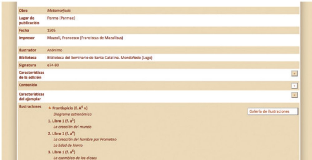
Fig. 3. Ejemplar en el sitio web < www.ovidiuspictus.es >.

contiene, con la que se corría el riesgo de resultar pesada, el usuario puede dirimir mediante una serie de pestañas que partes de la información quiere visualizar y cuales no, consiguiendo así no sobrecargar la pantalla con demasiado texto y haciendo la consulta mucho más ágil.