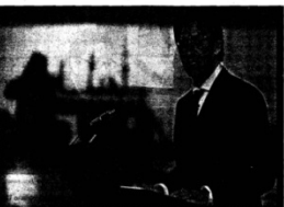
Feijóo, ayer durante su intervención en la Cátedra Jorge Juan en Ferrol (La Coruña)

Feijóo se refirió al espíritu de colaboración y cooperación que debe prevalecer en la gestión económica de la Xunta, basada en "el rigor, la prudencia, la eficiencia y la austeridad". Destacó el signo de la gestión económica que se debe adoptar en la Xunta, que no es el signo de la inversión y el gasto, sino el signo de la austeridad y el ahorro.