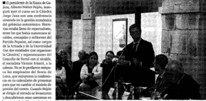
Alberto Núñez Feijóo, durante la conferencia, con Luis Barro y Santiago Barbar

Feijóo se refirió al espíritu de colaboración y cooperación que debe prevalecer en la gestión económica de la Xunta, basada en "el rigor, la prudencia, la eficiencia y la austeridad". Destacó el signo de la gestión económica que se debe adoptar en la Xunta, que no es el signo de la inversión y el gasto, sino el signo de la austeridad y el ahorro. Feijóo se refirió al espíritu de colaboración y cooperación que debe prevalecer en la gestión económica de la Xunta, basada en "el rigor, la prudencia, la eficiencia y la austeridad". Destacó el signo de la gestión económica que se debe adoptar en la Xunta, que no es el signo de la inversión y el gasto, sino el signo de la austeridad y el ahorro.