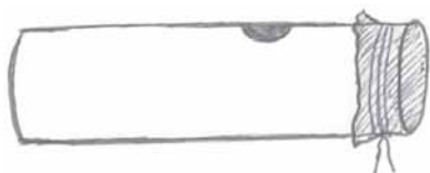
MIRLITÓN DE CANA