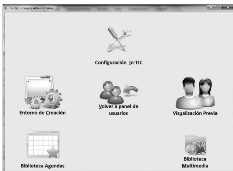
Figura 1. Perfil Administrador.

El profesional del ámbito educativo o sociosanitario (terapeuta ocupacional, logopeda, psicopedagogo, etc.) gestiona, a través de este perfil, los diferentes usuarios. Para cada uno de ellos puede crear las interfaces o teclados específicos, en función de sus capacidades, necesidades e intereses.