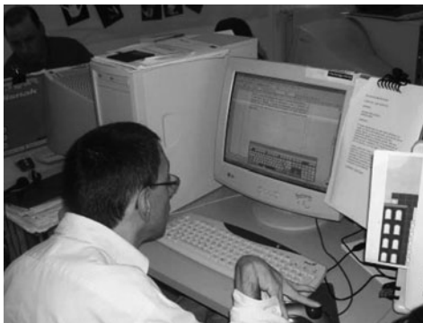
Figura 1. Usuario del Aula Ocupacional de Nuevas Tecnologías utilizando Ratón TrackBall, Teclado Virtual y opciones de accesibilidad de Windows.