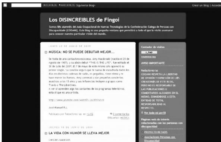
Figura 5. Creación de un blog digital como actividad de fomento de autonomía personal en participación social

Otra de las actividades encaminadas a este mismo fin fue la creación de un blog digital (Figura 5) de actualización mensual empleando la tecnología de apoyo incluida en los equipos de RETADIS. Los/as creadores/as y encargados/as de su mantenimiento son los/as usuarios/as del Aula Ocupacional de Nuevas Tecnologías, y se puede acceder a él mediante el enlace: http://disincreibles.blogspot.com .