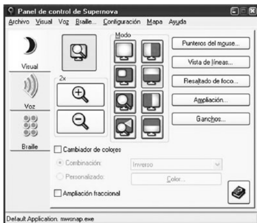
Figura 8: Captura de pantalla Software Supernova