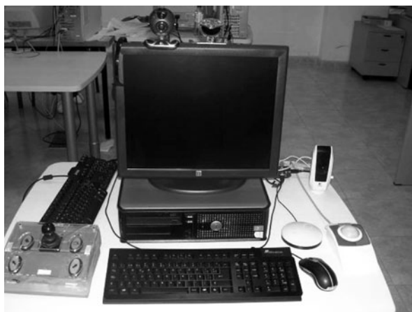
Figura 3. Equipo informático y productos de apoyo Proyecto RETADIS

En la comunidad autónoma de Galicia, el CRD Fingoi constituyó su primera sede, ampliándose en la fase II del proyecto una nueva sede ubicada en las instalaciones de la entidad Down Coruña. La presencia de dos equipos con diferentes adaptaciones y productos de apoyo, así como las comunicaciones necesarias para el acceso a Internet (necesario para acceder al Centro de Atención al Usuario y para la interconexión con el resto de equipos de la Red) han hecho posible ampliar la variedad de actividades terapéuticas de fomento de la Autonomía Personal vinculadas a las TIC, llevadas a cabo en el servicio de Terapia Ocupacional (Figura 3). En el momento en el que se llevó a cabo la instalación de los ordenadores, también se puso en marcha una página Web de soporte que permite en todo el territorio nacional aconsejar y recoger las consultas realizadas por cualquiera de las personas con discapacidad que utilicen estos ordenadores. La Red cuenta asimismo con el apoyo técnico del CEAPAT a través de la Unidad de Demostración de Equipos Adaptados instalada en sus locales.