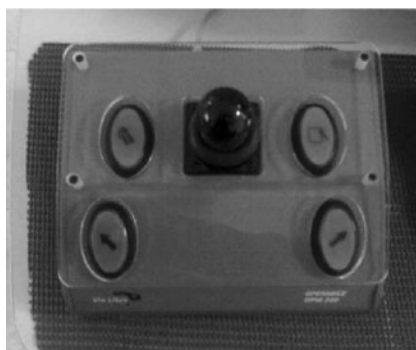
Figura 9: Ratón Joystick