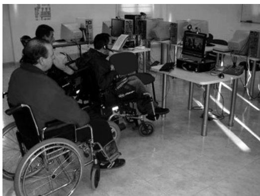
Figura 4. Actividades de fomento de participación social autónoma utilizando los productos de apoyo del Proyecto RETADIS

Además, para fomentar la participación social (Figura 4) de los usuarios se llevan a cabo diferentes encuentros por videoconferencia con otros/as usuarios/as de este proyecto de diferentes lugares de España, así como con personas de otras entidades. El entrenamiento en el uso de los productos de apoyo que necesita la persona mediante sesiones en las que se trabaja con diferentes programas de mensajería instantánea, chats, foros de opinión de distintas organizaciones, servicios de atención al ciudadano de diferentes organizaciones públicas y empresas privadas, entre otras herramientas disponibles en Internet, ha sido la forma escogida por la Terapeuta Ocupacional para la maximización de los niveles de autonomía personal en esta esfera.