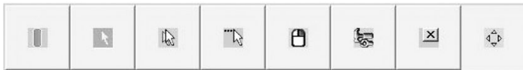
Figura 6. Captura de pantalla Software Dwell Clicker

personal en aspectos como: tamaño de la zona útil del puntero, tiempo activo, sonidos y ubicación en la pantalla. [6]