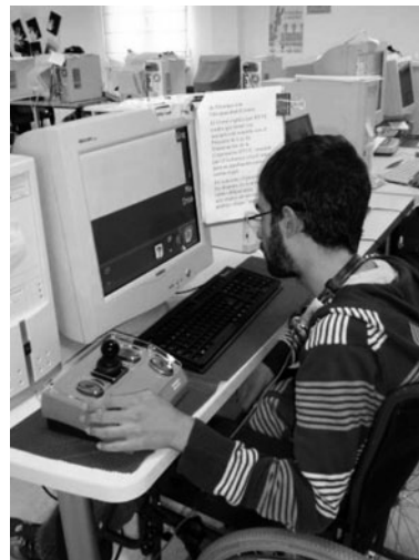
Figura 2. Usuario del Aula Ocupacional de Nuevas Tecnologías utilizando Ratón Joystick, Canalizador Dactilar y Magnificador de Pantalla.