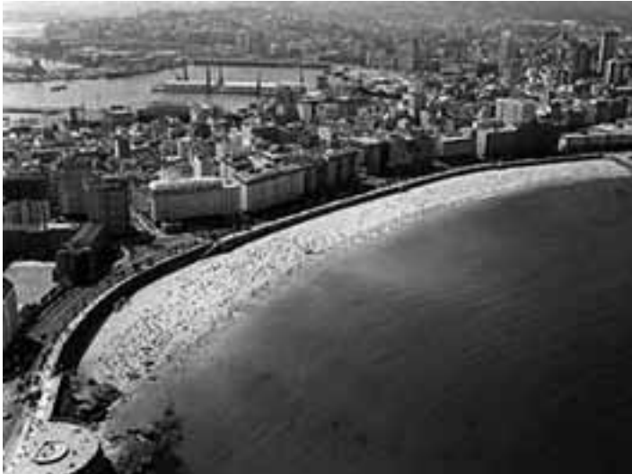
A coruñesa enseada do Orzán

E hai tamén morriña da terra que está lonxe. Eu quixen supor que foi a nostalxia do mar do seu Orzán, do noso Orzán coruñés, a que provocou que Gaos se trasladase á cidade balnearia arxentina e que elixise un apartamento con vistas ao mar. Alí foi composta esta obra, mirando o océano. Ese océano que é o mesmo que baña as costas galegas e que moldea e estreita o van da nosa fermosa cidade. Na enseada do Orzán.