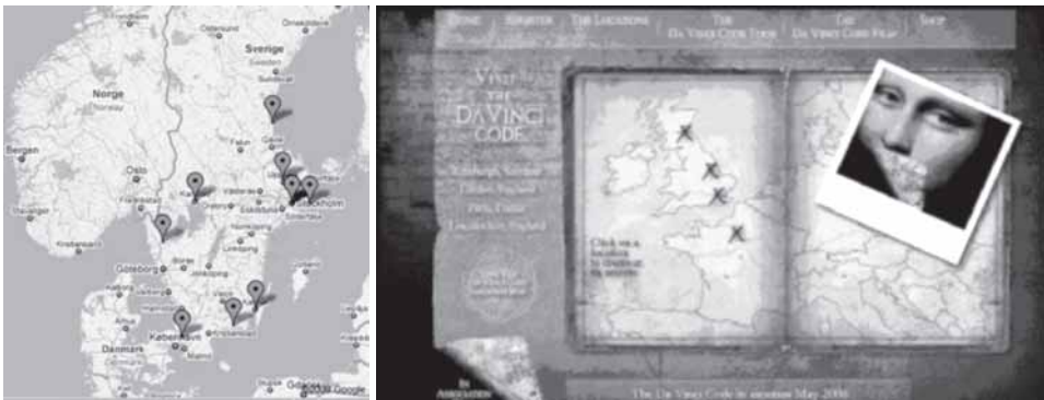
Figura 6. Imaxes de Turismo literario

Este tipo de turismo literario mestura referencias literarias e xeográficas, nun cóctel contemporáneo no que a realidade preséntase sublimada. Ao chegaren a eses sitios adornados coa prosa de Larsson, Cervantes ou Risco, suponse que os visitantes debemos sentir algo especial, non debe ser apenas unha visita senón unha experiencia que nos transporte dalgún xeito ás propias páxinas, para así acompañar a Mikael Blomkvist, Don Alonso Quijano ou Don Celidonio, polas canles de Estocolmo, as casas de venta manchegas ou as rúas de Ourense.