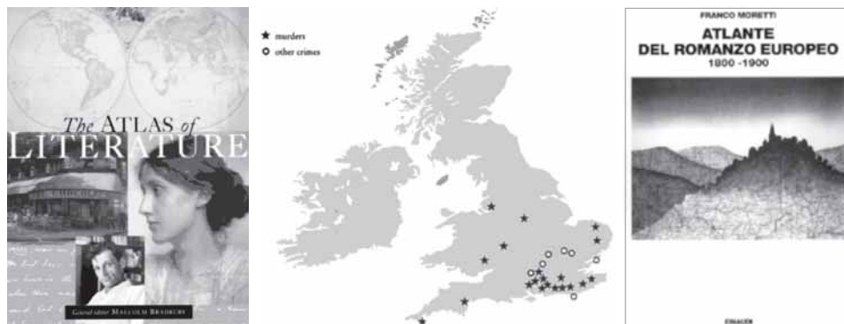
Figura 3. Portadas dos Atlas literarios e localización dos casos de Sherlock Holmes

Máis recentemente, a aparición das tecnoloxías de información xeográfica permiten proxectos innovadores como o Atlas literario de Europa do Instituto Cartográfico de Zurich, no que se intenta superar a imaxe estática dos atlas anteriores. Na páxina web www.literaturatlas.eu pódense consultar os avances de este traballo liderado pola profesora de estudos literarios Barbara Piatti. O obxectivo de este proxecto é trazar, sobre un sistema de información xeográfica, as características espaciais das obras literarias escritas desde 1750 que se desenvolven en tres áreas determinadas, unha rexión alpina suíza, o territorio costeiro alemán de Nordfriesland e a cidade de Praga.