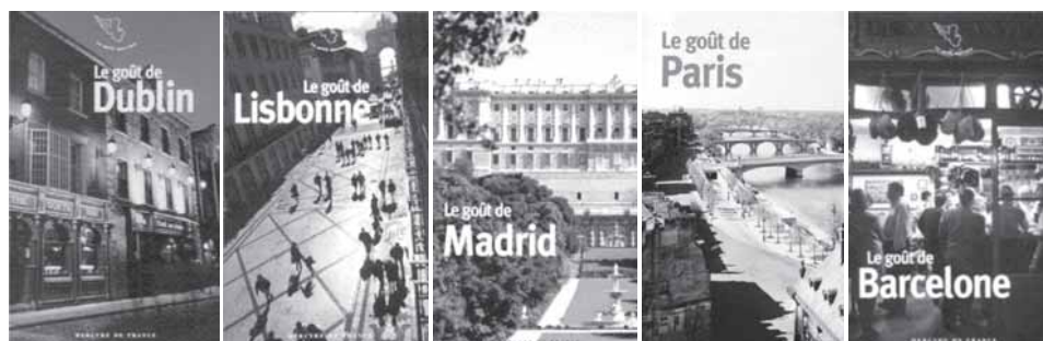
Figura 5. Guías turísticas da editorial Mercure da serie Le goût