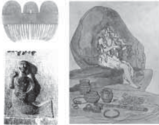
Promptema del «O Pente d'Ouro» y su encaje en el contexto ideológico «melusino» de la Soberanía.

la pieza más grande de su tesoro y la Moura desaparece. Entonces el objeto elegido se convierte en un carbón.