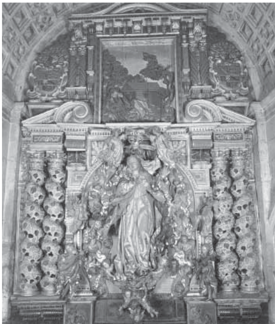
Ilustración 2. Asunción de la Catedral de Ourense. La Catedral de Ourense , A Coruña, Xuntanza Editorial, 1993.