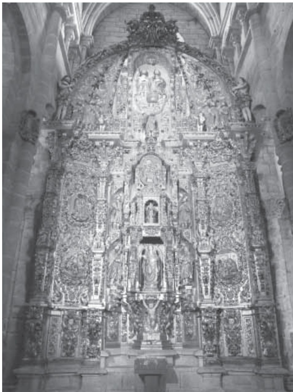
Ilustración 3. Retablo de la Catedral de Tuy.