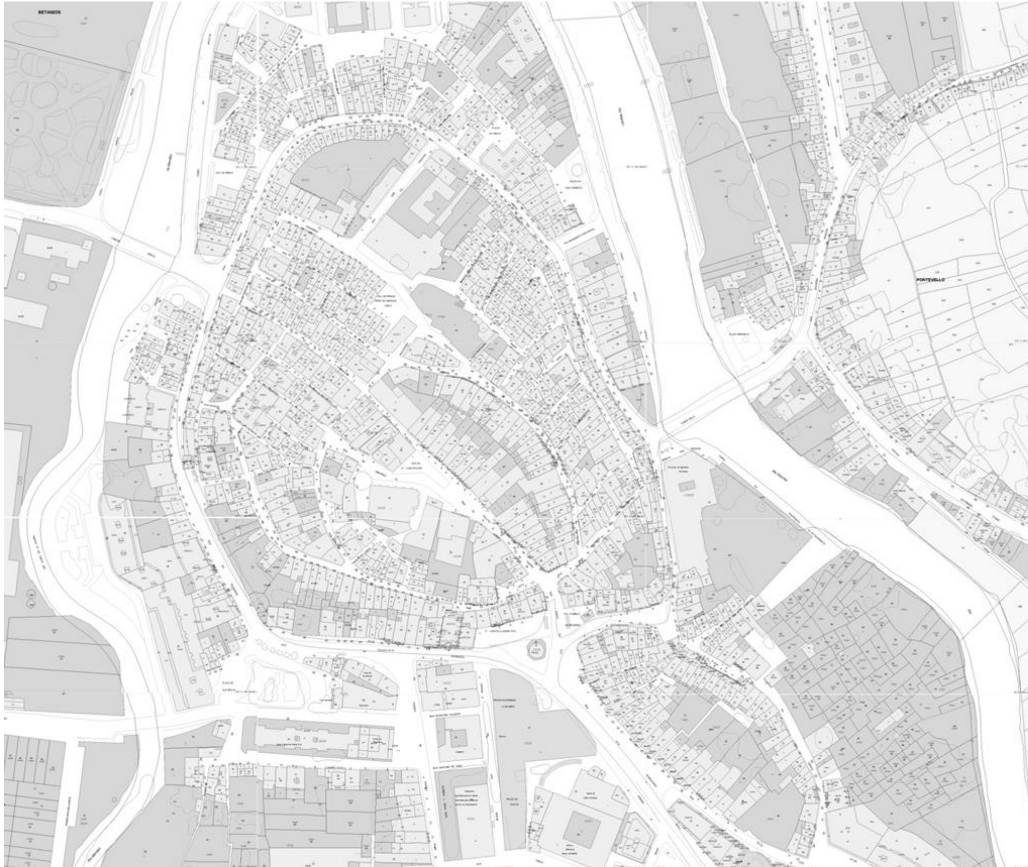
4_Planimetría del catastro de Betanzos, fecha de consulta: enero de 2014