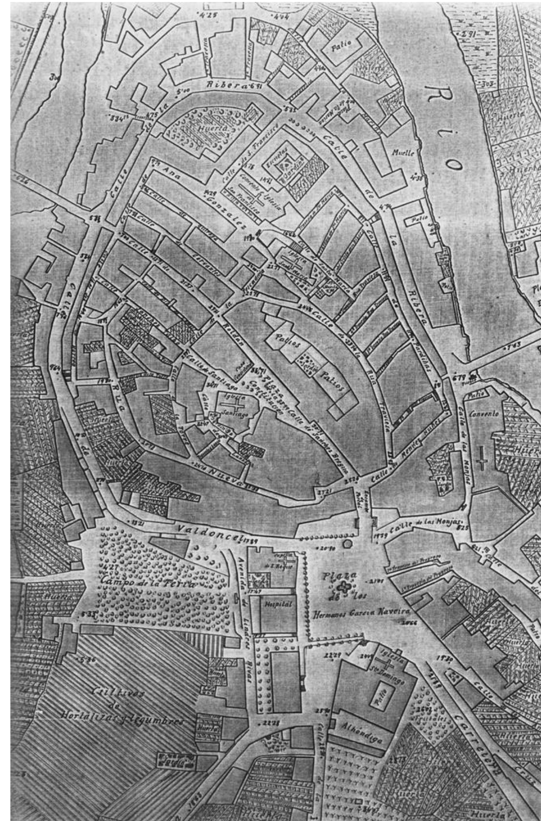
2_Plano facilitado por el Archivo Municipal de Betanzos y perteneciente a la publicación de MAdoz, Pascual, 1845, Diccionario Geográfico-Estadístico-Histórico de España y sus posesiones. Ed.: Bregón. Madrid.