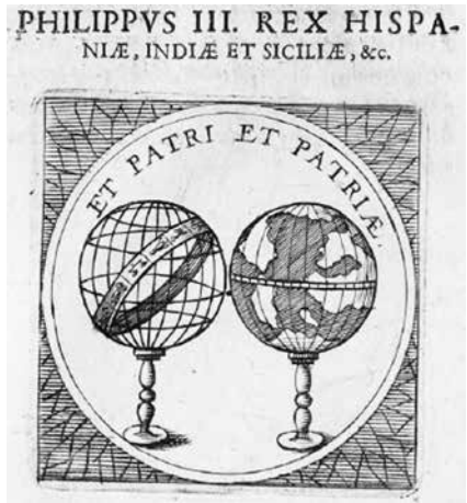
Fig. 2. Selectorum Symbolorum Heroicorum (1619: 137).

En los dos casos descritos por Covarrubias, la rama es de laurel y no de olivo, pero la diferencia de significado es poca, pues el olivo significaría la bonanza frente a la tormenta, la paz frente a la guerra, y el laurel invocaría el premio opuesto al castigo del rayo. En cualquier caso, clemencia y justicia o bien premio y castigo. Enfoques algo diferentes, pero vinculados ambos al poder exclusivo del monarca, que ha de mostrar su sabiduría en saber cuándo ha de ser benigno o inspirar temor, en ocasión y tiempo 5 .