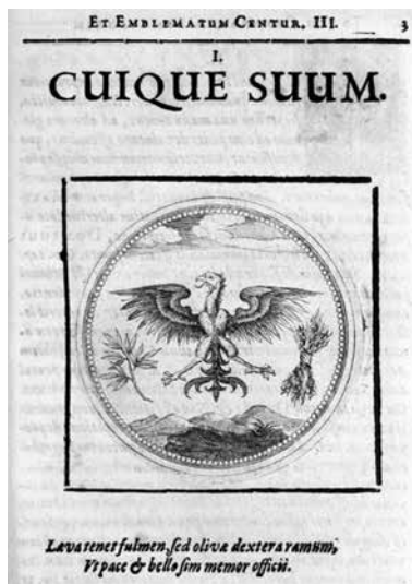
Fig. 3. J. Camerario, Symbolorum & Emblematum ex volatilibus et insectis desumptorum , 1604, simb. I.

También la recoge Jacob Typotius en sus Symbola ([1601-1603]: 48-49). A pesar de que la imagen representa una rama de laurel, en la explicación alude a una de palma, representación figurada del premio.