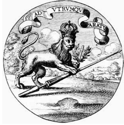
Fig. 6. Divisa de Felipe III. Ms. AMN 0843 Ms.2583 / 000 [p. 50].

Hemos podido ver, pues, que las empresas de Felipe III transmiten una imagen del monarca como defensor de la religión católica (es bien sabido que se le llamaba El Piadoso ), al que le preocupa tanto mantener sus posesiones terrenales heredadas como mantener y defender la religión, para merecer el título de «Católicos» que ostentan los reyes españoles desde Isabel y Fernando. Felipe, haciendo uso de su prerrogativa de rey, puede ser benévolo o riguroso, según la oportunidad, que administrará oportunamente. Está preparado tanto para la paz y para premiar a los buenos (que se expresa mediante el olivo o el laurel) como para afrontar la guerra y castigar a los herejes (la lanza y el rayo). Para ambas cosas está preparado el rey: para ser amado y para ser temido, respondiendo a la pregunta que formulaba Maquiavelo.