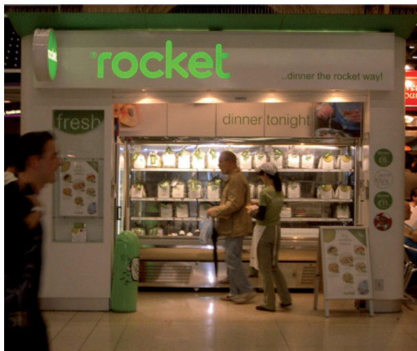
1 La imagen de un establecimiento Take Away en la London Victoria Station (2009) ayuda a visibilizar cómo los elementos que definen una realidad arquitectónica son heterogéneos, y provienen tanto del ámbito de lo técnico como de lo sociopolítico.