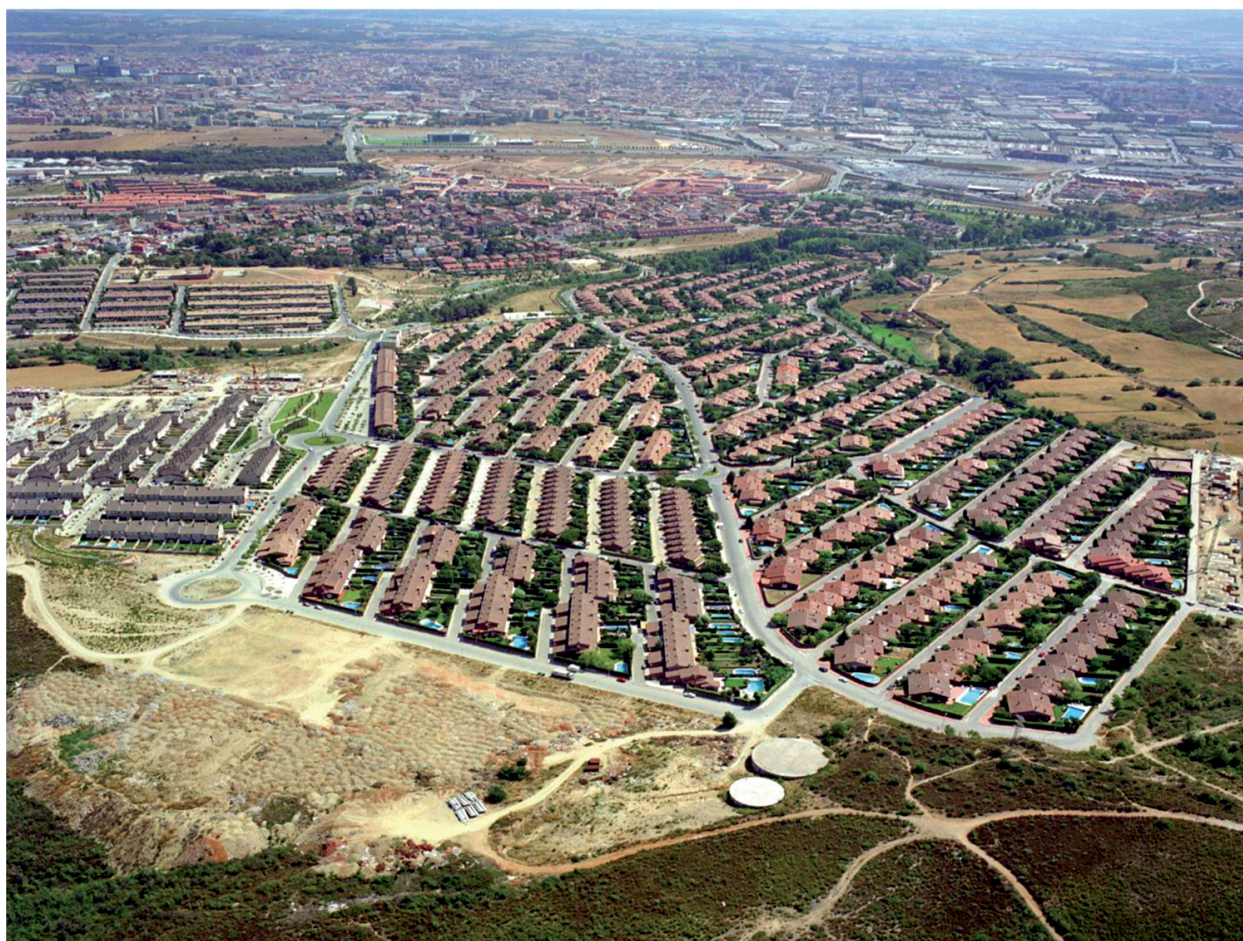
5 Nuevos barrios de vivienda unifamiliar de baja densidad: Sant Quirze del Vallès, Barcelona (2010).