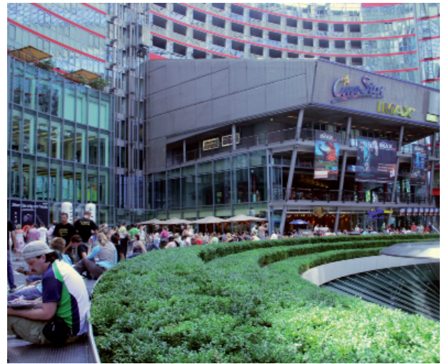
4 (Dcha.) Nuevos usos del espacio público: interior del edificio Sony en la Potsdamer Platz, Berlín (2008).

compradores de vivienda, que a buen seguro habrán pasado un tiempo en el mercado de alquiler pero habrán decidido pasar al mercado de compra toda vez decidido iniciar un proyecto vital o familiar. En otro, la variadísima galería de situaciones que representa el alquiler y que incluiría de alguna manera la realidad sumergida que se menciona en la pregunta. En mi opinión, mientras el acceso a la vivienda en propiedad esté primado, los proyectos de sensibilización, información y promoción de formas alternativas de acceso al alojamiento difícilmente pasaran de tener un interés meramente testimonial.