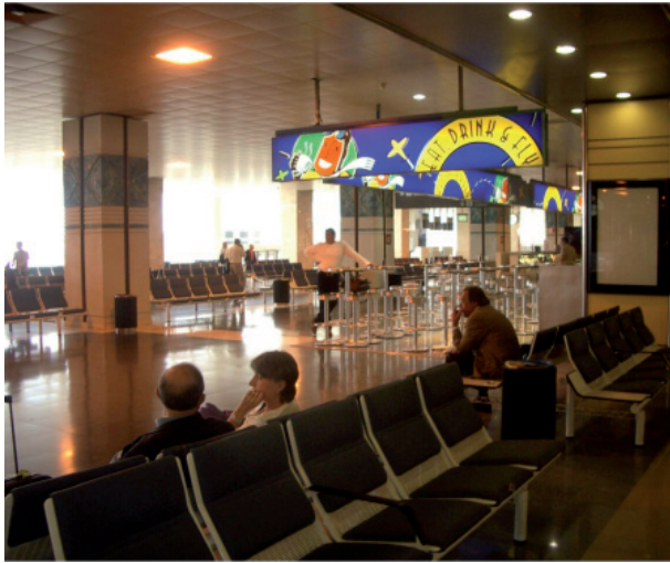
3 (Izda.) Escalas de proximidad: Eat, drink & fly , pasajeros esperando su vuelo en un aeropuerto (2010).