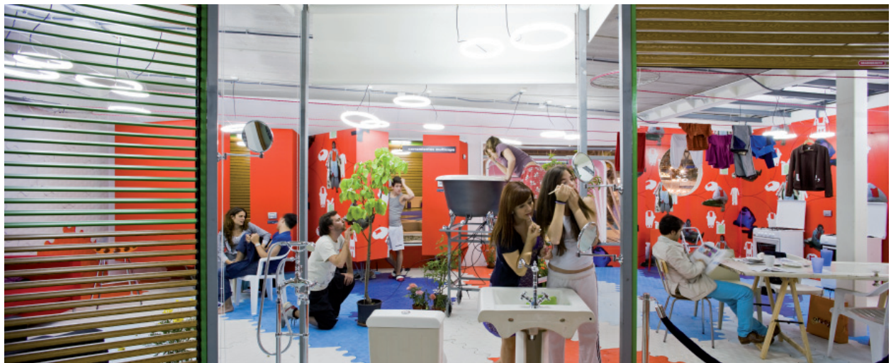
2 Andrés Jaque Arquitectos, Casa rodante para una sociedad rodante (2009); prototipo presentado en Barcelona. Esta casa fue diseñada apoyándose en los resultados de un estudio sobre hábitos de uso llevado a cabo por el autor.

Para mí, esto tiene varias implicaciones. La primera es que entre estos actores con afecciones diversas no es posible el consenso, por lo que se hace prioritario contar con marcos políticos que doten de garantías a los procesos de disputa. Lo segundo es que los procesos de transformación deben ser progresivos, y deben permitir en sus fases intermedias la evaluación de todos los agentes. Por estas razones hace años fundé la Oficina de Innovación Política, porque creo que es en este terreno en el que es necesario trabajar ahora desde la arquitectura y el urbanismo.