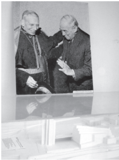
5 Fotografía del Cardenal Lercaro con Alvar Aalto, sobre la maqueta del conjunto parroquial de Nuestra Señora Asumpta que se encuentra en el interior de la propia iglesia, en Riola di Vergato (Bologna).

el espacio moderno, y el que sabe de arquitectura entiende el espacio moderno. El arte moderno, la arquitectura moderna, son difícilísimos de comprender. Y verdaderamente, sería muy presuntuoso por nuestra parte pensar que Lercaro entendía todo.