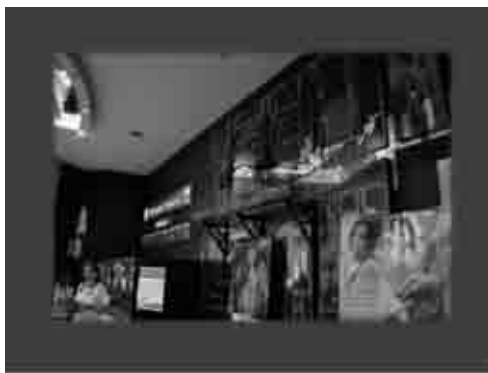
Figuras 10: Canoa no cinema 2.

Em outro restaurante deste grande centro comercial, localizamos a canoa compondo o teto (como lustres), nas paredes e no vidro de uma das janelas (como intervenções decorativas) [Figuras 13, 14, 15, 16 e 17].