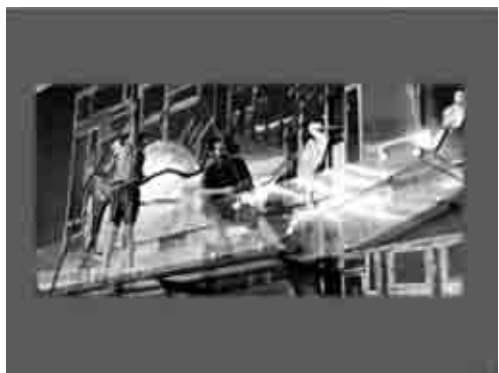
Figuras 09: Canoa no cinema 1

Ainda pelas andanças neste shopping deparamos com as representações de canoas em alguns restaurantes, ornando de diferentes e variadas formas a ambiência da praça de alimentação. Na Imagem 10, uma fotografia preto e branco da canoa exibindo dois pescadores acompanha