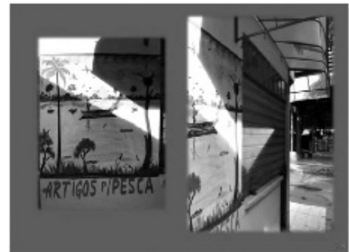
Figuras 02 e 03: (Figura 02) Canoa na avenida