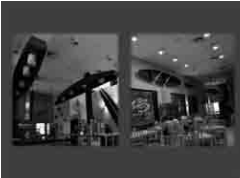
Figuras 09: Canoa no restaurante A 1.