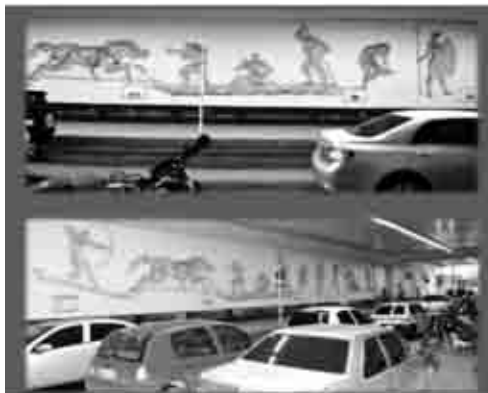
Figuras 06: Acervo GPEA/UFMT, fotografia de João Quadros. Canoa na feira 2.