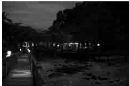
Figura 3: Bom Bom Island Resort Restaurante e Bar.

O BBIR encontra-se neste momento na fase de planificação e estabelecimento de metas a alcançar. A certificação será um meio de efectivamente quantificar e comprovar as metas desejáveis para o resort. No entanto, este será um grande desafio uma vez que falamos de um hotel com 20 anos de existência, situado num local muito remoto, com difícil acesso e com grandes limitações de infraestruturas externas. Será um processo muito interessante e importante no que respeita o desenvolvimento e preservação das riquezas deste local único, a Ilha do Príncipe.