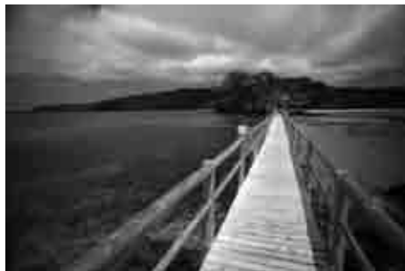
Figura 2: Bom Bom Island Resort.

A qualidade é considerada um factor chave no sucesso de um destino e negócio turístico; é, portanto um elemento essencial de estratégia. Melhorar a qualidade e aumentar a satisfação dos visitantes permite atingir melhores resultados e contribuir para a competitividade, sendo este um dos objectivos do BBIR. O BBIR procura elevar os standards da qualidade ao mesmo tempo que promove viagens responsáveis para áreas naturais que conservem o ambiente e promovam o bem-estar da comunidade local, associado a três princípios gerais: benefícios para a conservação da natureza, para a comunidade local e económicos.