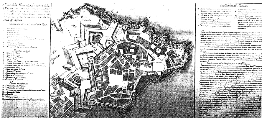
fig.2. Fortificaciones de A Coruña por Pedro Martín Cermeño. 1785

La parte hacia el Norte del recinto, inmediatamente contigua al bastión del mismo nombre, está expuesta a ser destruida desde cualquier lugar próximo (desde los extensos campos existentes en la zona oeste de la península) porque toda la base del muro es visible desde allí.