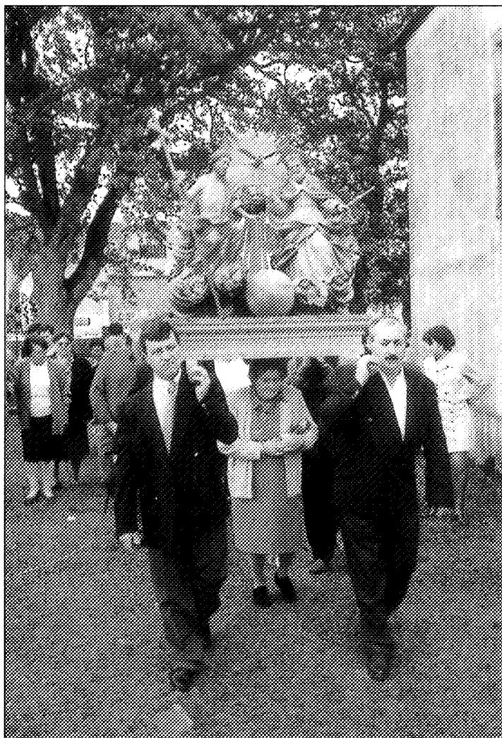
Santuario da Trindade de Vián (A Pastoriza): Na procesión, que percorre o perímetro do Santuario, aínda van algúns devotos baixo as andas dalgúns imaxes