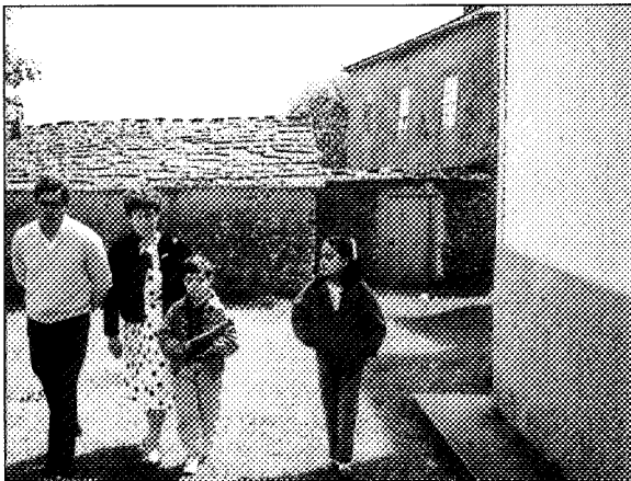
Santuario dos Milagres de Saavedra (Begonte): Un pequeno, acompañado da súa familia, realiza o ritual da ciscunvalación, levando nas súas mans unha imaxe pequena da Virxe

Finalmente quero manifestar que os continuos cambios e transformacións que se vaian levando a cabo no futuro poden facer posible que determinadas manifestacións da relixiosidade popular sufran cambios formais, mais estas novas expresións seguirán máis ligadas os niveis da relixiosidade popular que ós da relixiosidade oficial.