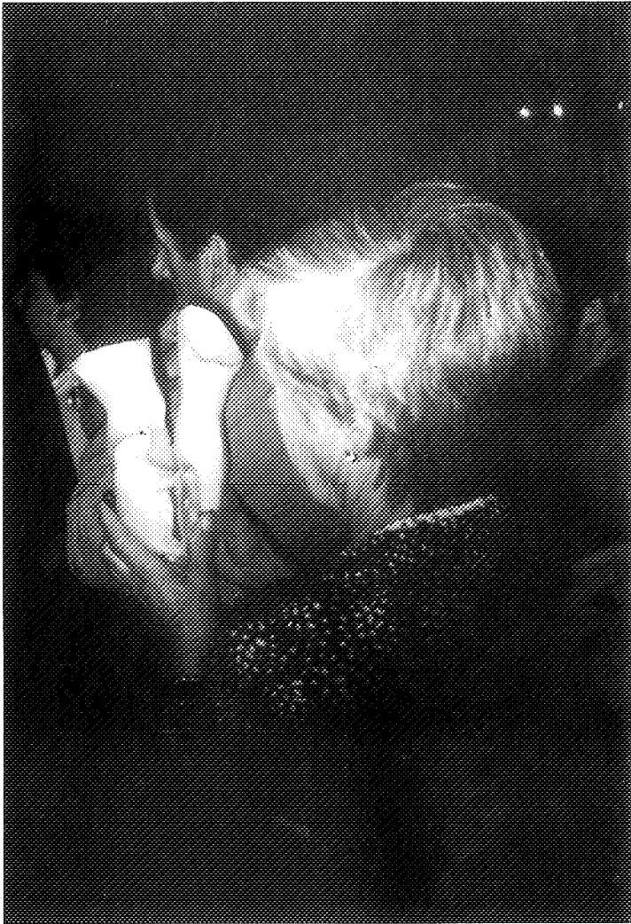
Nun santuario chairego unha devota leva ex-votos de cera de distinta natureza.