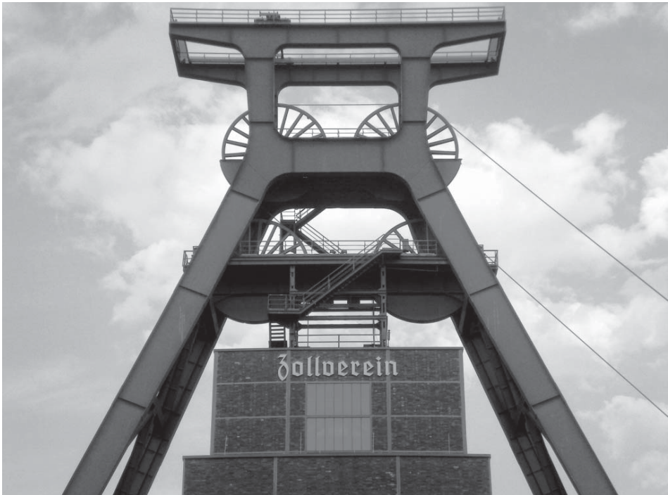
Figura 3. Castillete del pozo XII de la mina de Zollverein