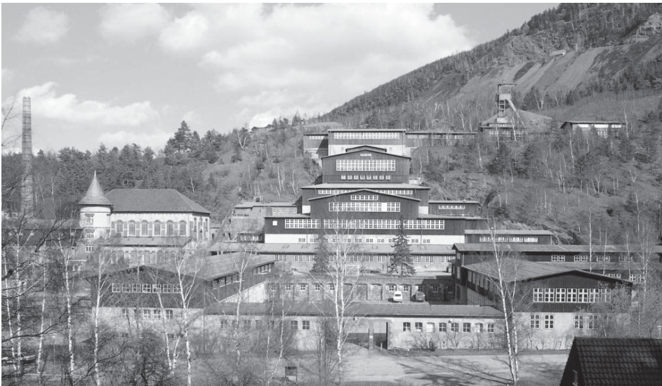
Figura 5. Exterior de la mina de Rammelsberg