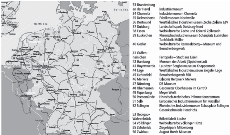
Figura 1. Mapa de los puntos de anclaje de la Ruta Europea del Patrimonio Industrial en Alemania