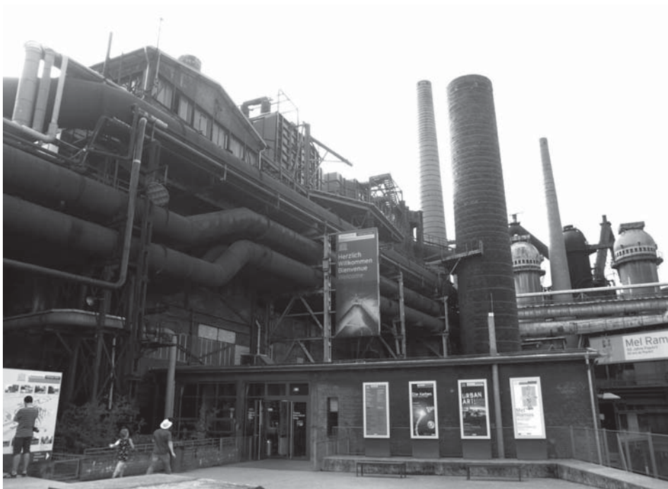
Figura 2. Exterior de la fábrica siderúrgica de Völklingen

XXI. Seguidamente se accede al antiguo almacén de minerales con una superficie de 1.000m 2 y que hoy en día sirve como sala de exposiciones. En este edificio se encuentra el Laboratorio de Ideas ( Das Ideenlaboratorium ®) ideado para ejercer como espacio para la reflexión sobre el futuro de la región de Sarre y que es parte de su estrategia de innovación. Desde aquí se puede disfrutar de una vista panorámica de la ciudad y de la planta de Völklingen tanto de día como por la noche gracias a la iluminación de la que dispone el recinto desde el año 1999.