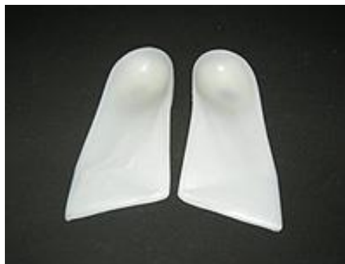
Ilustración 2: Gait Plates

En cuanto al tratamiento ortopodológico, uno de los más utilizados es la ferulización del V radio, “Gait Plates” o cuña rotadora externa 10 (Ilustración 2).