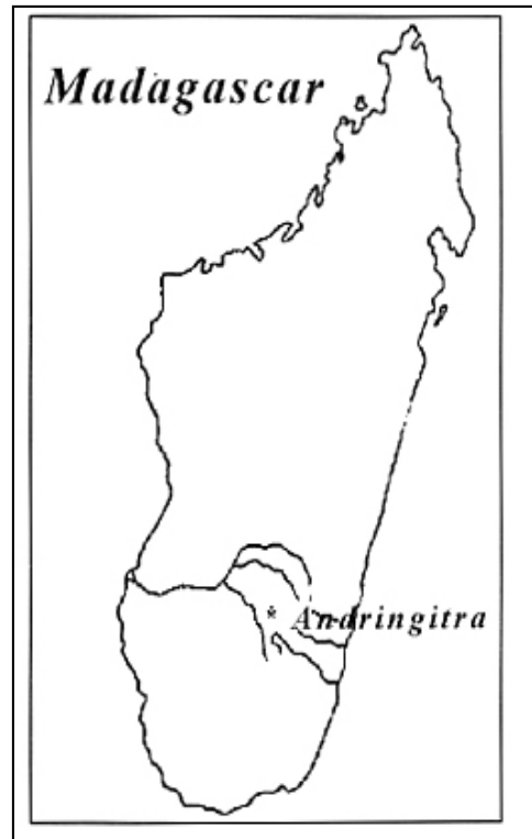
Fig. 1. Mapa mostrando la localización del área de trabajo.

El uso de los isótopos estables de elementos biológicamente importantes,