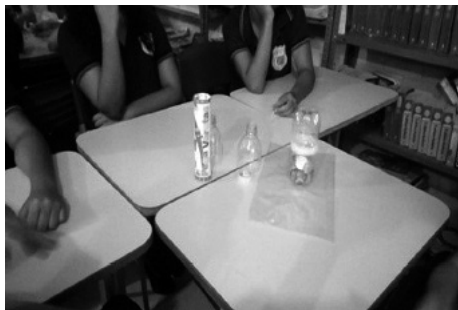
Figura 2: (B) Atividade Lúdica.

Nesta fase a pesquisadora percebeu o despertar dos alunos ao se manifestarem