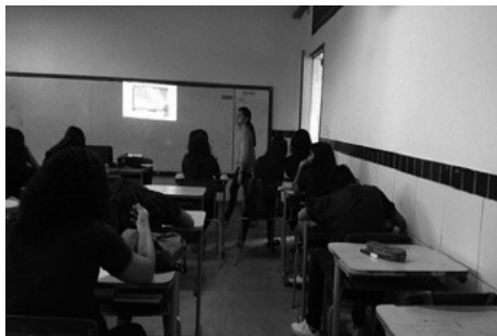
Figura 1:(A) Análise da temática Ambiental – Resíduos e sustentabilidade.

A partir das discussões ocorridas, concluiu-se também que os resultados se tornaram mais significativos no aprendizado em relação aos destinos de determinados resíduos.