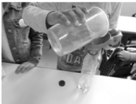
Fotografia 1: Os alunos, recorrendo a um funil e a um copo graduado, colocavam em cada garrafa a mesma quantidade de água potável.

de novos comportamentos em situações do seu dia-a-dia, como, por exemplo, reconhecer a água potável e água não potável quando se deparavam com uma fonte ou fontanário, nas saídas de campo efetuadas à posteriori.