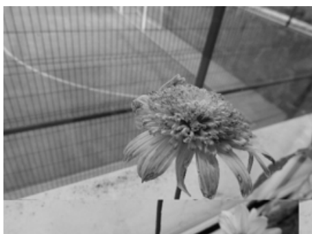
Fotografias 5 e 6: Os alunos observaram que as flores mudaram de cor, adquirindo a cor do corante alimentar adicionado à água. Ao fim de alguns dias, além da coloração adquirida, a flor também estava a morrer.