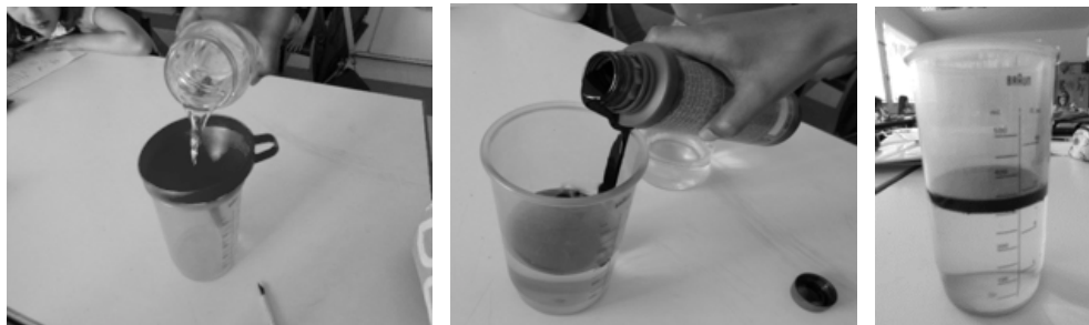
Fotografias 7,8 e 9: Os alunos, utilizando um funil, colocaram óleo num copo graduado contendo água potável. De seguida verificaram que se formava uma espessa camada de óleo à superfície, a qual poderia impedir a passagem de gases (oxigénio) e de luz solar para a água

que as crianças têm de interpretar ou de problemas que têm de resolver” (p.11), pelo que se considera fundamental partir de problemáticas ambientais associadas ao quotidiano dos alunos, por forma a motivá-los a encontrarem respostas para as questões problema colocadas e melhorar a sua compreensão dos fenómenos em estudo. Desta forma, as atividades científicas, segundo FIALHO (2010), “permitem expandir o conhecimento e a compreensão do mundo físico e biológico” (p.3), contextualizando os conhecimentos, aprofundando os conceitos e estimulando a curiosidade dos alunos, conforme se constatou através da realização, pelos alunos, incluindo os alunos com NEE, do conjunto de atividades práticas/experimentais a que pertenciam as três atividades anteriormente referidas.