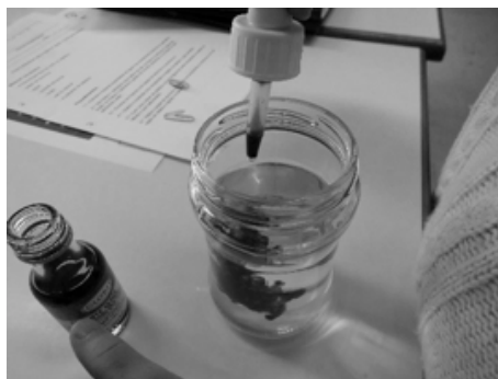
Fotografias 3, 4 e 5: Os alunos, utilizando um conta-gotas, colocavam algumas gotas de corante alimentar no recipiente onde se iriam colocar as flores.

oceanos e orlas costeiras decorrente, em grande parte, de acidentes com petroleiros. Nesse âmbito, os alunos tentaram, recorrendo a uma atividade prática, ilustrada nas fotografias 7, 8 e 9, responder à questão-problema: “O que acontece ao óleo quando colocado em água?”. Na sequência da realização desta atividade, os alunos perceberam que o óleo não se misturou na água, tendo formado uma camada que ficou a flutuar. No debate subsequente, foi possível aos alunos relacionar esta situação com os impactos sobre os seres vivos da eventual carência de oxigênio em águas em que tenham sido/sejam lançados óleos ou outras substâncias gordurosas, por se encontrem isolados da atmosfera pela película de óleo (gordura) que, por diferença de densidade, fica a flutuar sobre a massa de água onde existem e a isola da atmosfera.