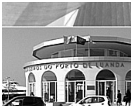
Figura 8. Exemplo de filmagem em Angola sobre promoção de uma mobilidade mais sustentável.