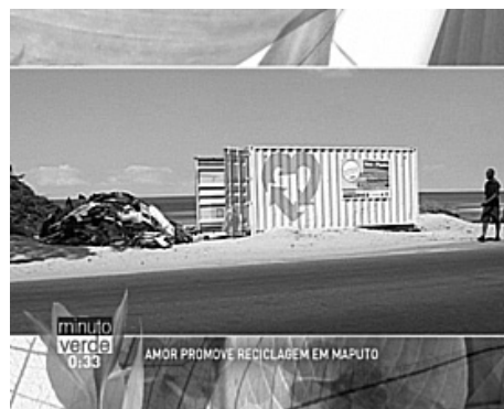
Figura 3. Exemplo de filmagem em Moçambique sobre reciclagem de resíduos urbanos

arredores, dos temas abordados foram a gestão da água e o saneamento, a gestão de resíduos, as alterações climáticas e as