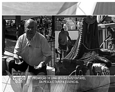
Figura 1. Exemplo de filmagem em Cabo Verde sobre sustentabilidade na pesca, Ilha da Santiago

A gravação de 20 programas em Cabo Verde decorreu em março de 2012, nas ilhas