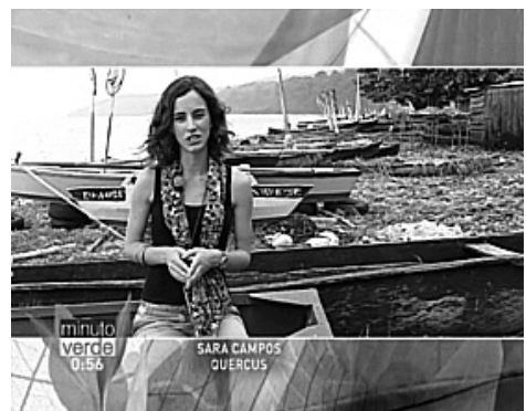
Figura 6. Exemplo de filmagem em São Tomé e Príncipe sobre importância de recursos marinhos.

Por outro lado, abordaram-se também as mais-valias naturais e paisagísticas de um país que, não obstante a sua muito reduzida dimensão, concentra uma biodiversidade endémica e abundância de recursos naturais impressionantes e que urge preservar, através de uma gestão e exploração sustentáveis. O ecoturismo e o trabalho desenvolvido pelas Organizações Não Governamentais locais ao nível da educação ambiental para proteção dos recursos