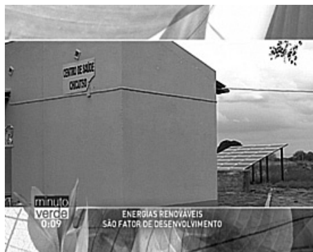
Figura 4. Exemplo de filmagem em Moçambique sobre recurso a energias renováveis.

energias renováveis. No Parque Nacional da Gorongosa, os temas focaram a importância natural da área, o envolvimento das comunidades no projeto de restauração do Parque, e ainda a promoção do ecoturismo num contexto de desenvolvimento sustentável. Os episódios foram emitidos ao longo de seis meses entre maio e outubro de 2012 (Figuras 3 e 4). A Tabela 2 apresenta os títulos e os locais de filmagem dos diferentes episódios.