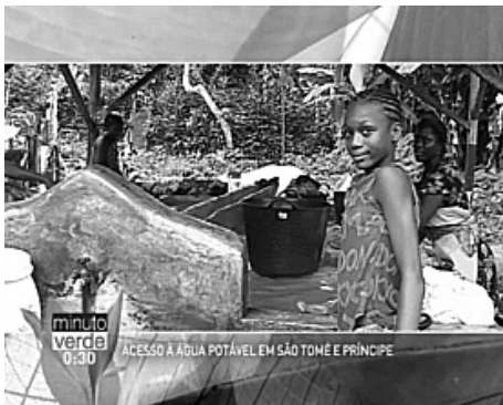
Figura 5. Exemplo de filmagem em São Tomé e Príncipe sobre acesso à água potável.

Em maio de 2013, foram realizados 15 programas da rubrica “Minuto Verde”. As gravações concentraram-se na Ilha de São Tomé, onde foram gravados 14 episódios, pelo simbolismo de ser marcado pela linha do Equador. Participaram nas