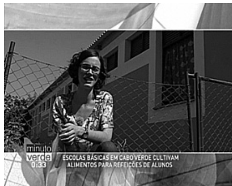
Figura 2. Exemplo de filmagem em Cabo Verde sobre hortas escolares, Ilha da Santiago

Em Cabo Verde, todo o trabalho resultou de uma comunicação e participação de diversas entidades: o Ministério do Ambiente, Habitação e Ordenamento do Território de Cabo Verde, em particular, a Direção Geral do Ambiente de Cabo Verde; a Fundação Caboverdiana de Ação Social