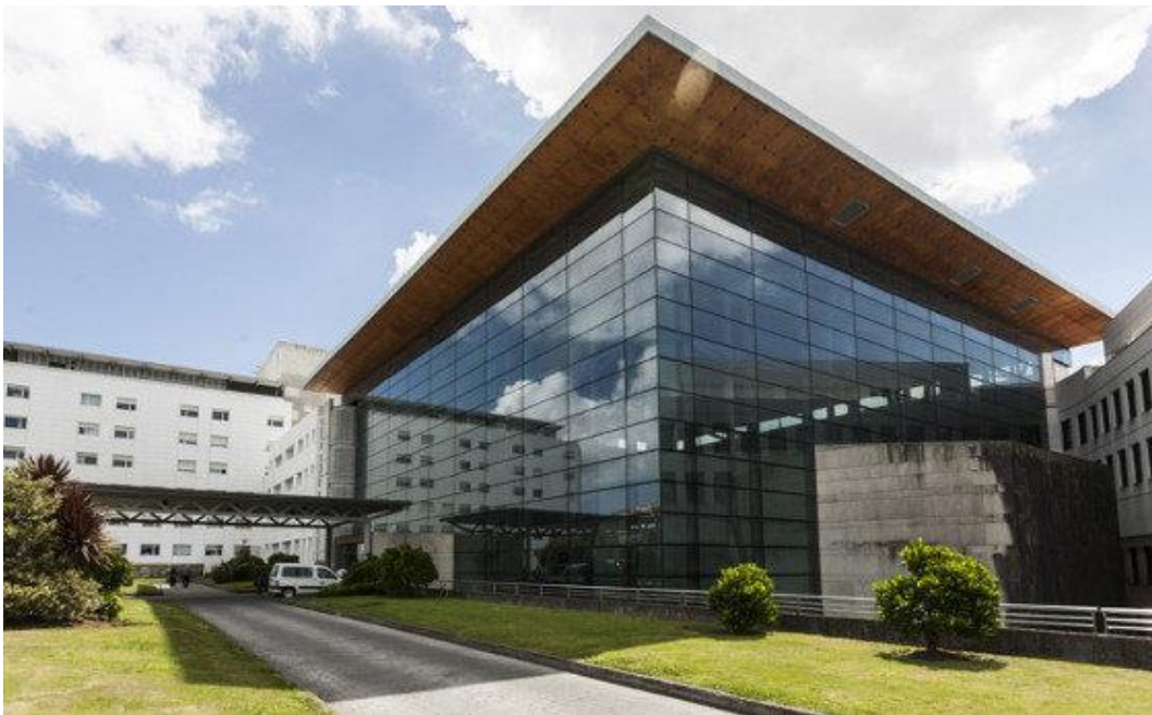
Figura 1: CHUF

Este estudio se llevara a cabo en el Servicio de medicina interna del Complejos Hospitalario Universitario de Ferrol.