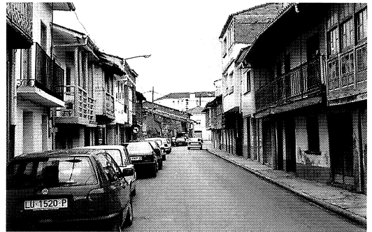
Figura 3 Tipos tradicionales en tapia

encontrar está formado por estrechas viviendas en hilera agrupadas en lo que se ha dado en llamar rueiros , de bajo, planta alta y fallado, con profundas solainas —que no galerías— en planta alta, con y sin jabalcones, edificaciones que son soportadas por los muros medianeros ejecutados con tapia o mampostería. Desocupadas en su mayoría, estas construcciones tienen los días contados. Más avanzado es el tipo constituido por bajo, planta alta, planta segunda con una poco profunda galería y fallado. Edificación también en hilera, la crujía se amplía hasta alcanzar los 8 m. Se apoya también en muros medianeros de los mismos materiales anteriores, pero en este caso a través de un orden estructural más: vigas transversales reciben las viguetas de madera que soportan el entarimado del piso. Por último, del cambio de siglo es un tercer tipo de las mismas características que el anterior pero con fachadas lisas y ático ocupando el tercio central de la fachada, ejecutado con idénticos materiales. Las cubiertas, siempre de teja curva.