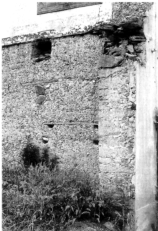
Figura 6 Soluciones constructivas: losas de piedras entre tapialadas