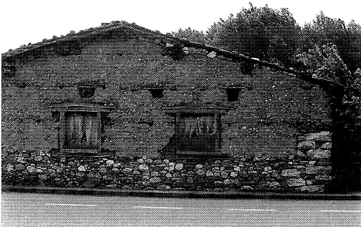
Figura 2 Soluciones constructivas de la construcción en tierra

La durabilidad de la construcción realizada con tapial exige la defensa contra todo tipo de humedad. Es éste el agente que arruina la tapia con mayor facilidad. Por ello históricamente cada tipo de humedad ha recibido una respuesta específica. Así, las humedades por testa se han afrontado con la disposición de elementos de cobertura superior; el ataque directo del agua de lluvia sobre la superficie del muro se ha resuelto impermeabilizando la superficie del muro bien por calicostrado —incorporación de cal al material que conforma el muro en las inmediaciones de las puertas, de forma que se produce un cierto fraguado superficial— o procediendo al embarrado —tendido de un mortero de cal y barro como recubrimiento en las caras expuestas— una vez rematado el muro; y las humedades provinientes del terreno o de capilaridad se han afrontado con el arranque de la construcción sobre un zócalo, denominado pumpido , de unos 50 cm de alto a base de mampostería u otro elemento que impida la ascensión de humedades por capilaridad.