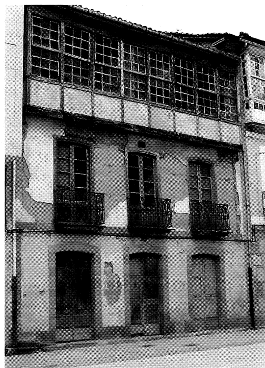
Figura 5 Soluciones constructivas P. baja fachada de piedra y muros portantes de tapia

Las demoliciones inherentes a todo proceso de sustitución permiten estudiar las características constructivas de estas edificaciones. Se pueden observar la conformación de los muros medianeros en tapial,