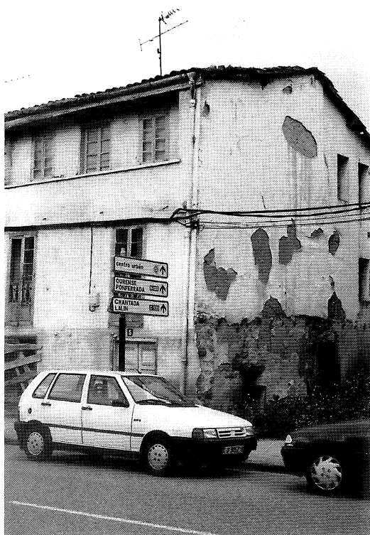
Figura 4 Tipos tradicionales

Se encuentran fachadas ejecutadas con mampostería en planta baja mientras que los muros resistentes se reservan a la tapia. Pese a la sorpresa que causa inicialmente, el planteamiento es de una lógica aplastante: la planta baja de fachada es la que mayores agresiones sufre por contacto con la humedad. La solución se explica en el afán de garantizar la durabilidad de la construcción frente a la acción de agentes agresivos