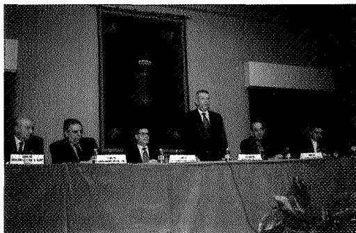
Acto de relevo en la Dirección de la Cátedra «Jorge Juan»: Presidencia.