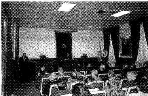
Actividades Curso 1999-2000.