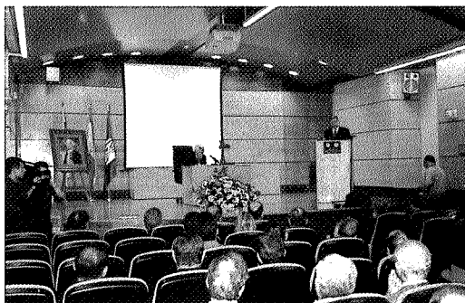
Actividades Curso 1999-2000.