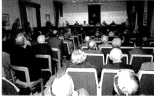
Actividades Curso 1999-2000.

En la actividad de colaboración con otras instituciones debemos destacar las siguientes: El día 5 de octubre de 2000 visita de los alumnos de la Escuela Superior de Arquitectura de la Universidad de Navarra al Arsenal Militar de Ferrol, durante la cual se impartió una conferencia por el Director de esta Cátedra sobre «LA ARQUITECTURA MILITAR HISTÓRICA DE ESTA BASE NAVAL Y SU PARTICULAR OBRA DEL DIQUE DE CARENAR DE SAN JULIÁN».