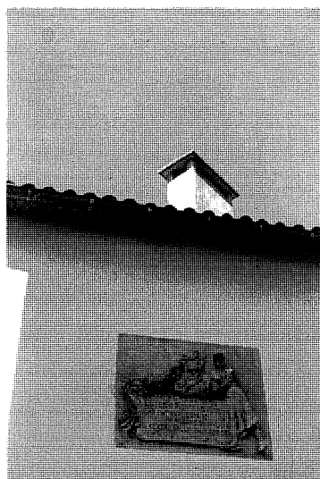
Casa natal de Montero Ríos, na rúa dos Xasmíns, en Santiago