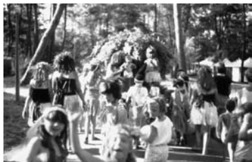
Figura 6. Animación temática de tradiciones

en diversas zonas del país emergen iniciativas de fomento productivo y activación económica con títulos o subtítulos referidos a ello: etno-turismo, turismo rural, ecoturismo, turismo alternativo, turismo de aventura como algunas de sus formas.