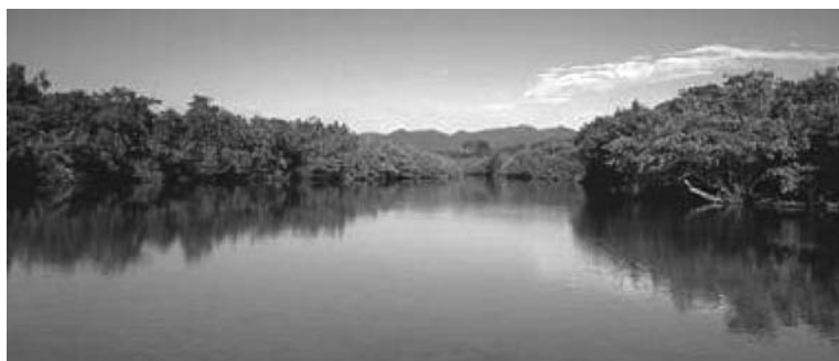
Figura 3. Marismas de la Riviera Nayarit.

Entre todos ellos, conjuntan una enorme y variada gama de atractivos turísticos 5 , como: sol y playa, con hoteles en plan Europeo o de Todo Incluido de lujo; Ecoturismo: buceo, snorkel, avistamiento de ballenas, nado con delfines y recorrido por manglares; Turismo de Aventura: surf, tirolesa y expediciones; Turismo Cultural: gastronomía, alberga a cuatro grupos étnicos, tradiciones populares, folclor y artesanías; y actividades de Turismo Premium, como golf, pesca, marina, velleo y Spas, por mencionar sólo algunos. Cada uno de los destinos de la Riviera Nayarit, ubicados frente al Pacífico, ofrece algo en particular. Nuevo Vallarta, a la que se le puede considerar su “capital”, concentra la mayoría de los hoteles, al igual que Flamingos, donde también se juega golf. Bucerías es un típico pueblo de pescadores, con plaza principal y calles empedradas; La Cruz de