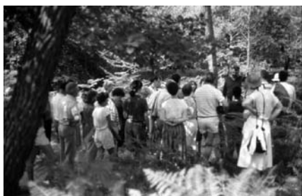
Figura 7. Animación de senderos de interpretación.

el punto de partida y de llegada de experiencias de fomento productivo rural innovador y efectivo. Las capacidades emprendedoras de los habitantes (especialmente rurales), su capacidad de trabajo, su conocimiento del medio natural (y de la tierra), su cultura y tradiciones, sus capacidades de organización asociativa, entre muchas otras características, son el “saber hacer” básico que encierra la ani-