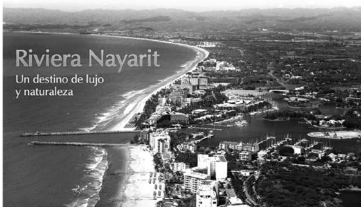
Figura 2. Riviera Nayarit, Nuevo Vallarta.

Durante años buscó su apoyo para promocionarse como un mismo centro turístico con el sólo nombre de “Vallarta”, sin el “Puerto” ni el “Nuevo”. Pero no funcionó. En la búsqueda de una identidad propia, tuvieron varios intentos malogrados. Lo mismo se auto nombraron “Vallarta Bay”, de lo cual nadie se acuerda, que “el Corredor Turístico Vallarta-San Blas”, durante el gobierno estatal anterior, en un afán por extenderse, unir fuerzas e incluir como marca de destino a los muchos poblados que se localizan en esa franja costera. Luego se auto denominaron “Vallarta Nayarit”, en un nuevo intento por encontrar una personalidad única, que hiciera entender a la gente que son otra cosa diferente y separada de Puerto Vallarta, un destino de lujo y moderno, frente a lo tradicional que ya resulta Puerto Vallarta, pero no lo lograron del todo.