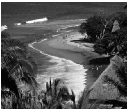
Figura 4. Sayulita, Nayarit, México.

individuales y colectivos por parte de múltiples protagonistas. Se le atribuye la responsabilidad a la empresa turística, como generadora de riqueza económica y social, tanto al exterior como al interior. Por un lado, el exterior convence a aquellos que no son del sector turístico de la importancia del turismo como creador de riqueza y, por el otro, también se abre las puertas hacia adentro. Esto conlleva un cambio en el sistema de gestionar los recursos humanos que supone investigar, profundizar en este campo y encontrar la manera de gestionarlo de forma diferente a la actual, ya que “siendo la principal