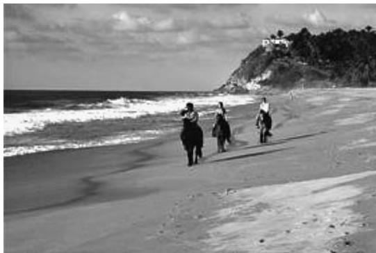
Figura 5. San Francisco, Nayarit, México.