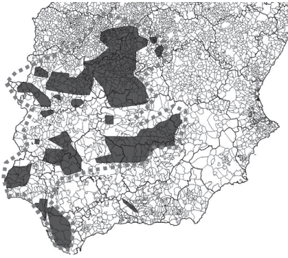
Plano 1: Ámbito de actuación

A contribución á recuperación da aguiá imperial ibérica desde o programa "Alzando o voo" formúlase coa incorporación de medidas de xestión para a mellora do seu hábitat, medidas de xestión que fomenten as poboacións da súa principal presa, o coello, a loita contra as principais ameazas que afectan a especie, e, por suposto, coa participación e sensibilización de todos os sectores e actores sociais que conviven coa especie e que dun xeito ou outra están implicados na súa conservación. Para levar a cabo este traballo e alcanzar estes obxectivos é indispensable recorrer aos instrumentos sociais obxecto deste seminario: a comunicación, a educación, a participación e a sensibilización, que serán utilizados para desenvolver as tres liñas principais de actuación nas que se estrutura o Programa "Alzando o voo": Xestión de hábitat, conservación e participación, e sensibilización e difusión.