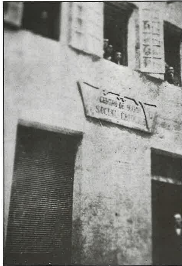
Fotografía 4. Edificio do Centro de Acción Social Católico de Mondoñedo.