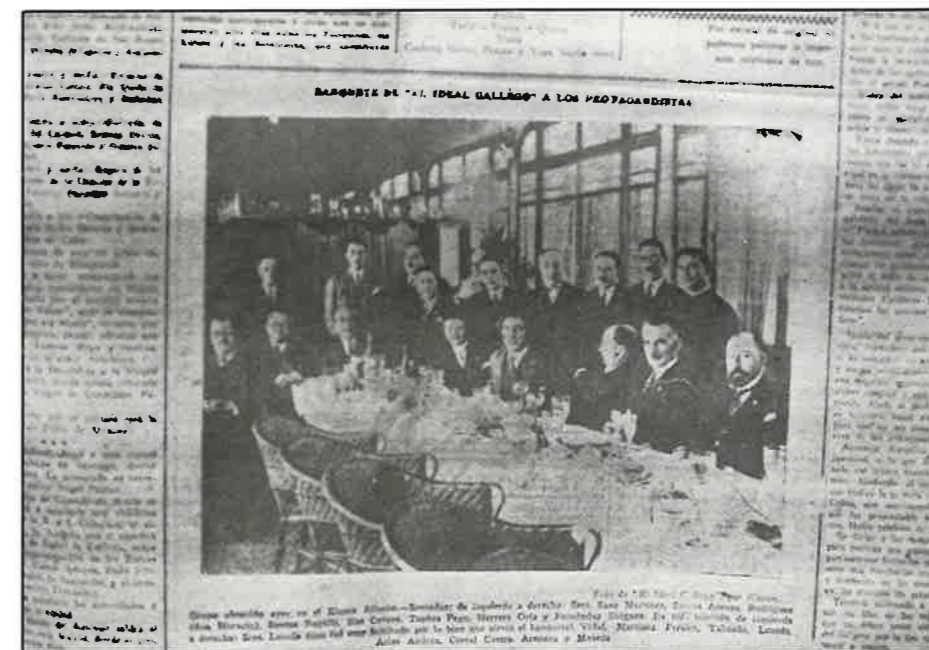
Fotografía 6. Banquete ofrecido polo xornal El Ideal Gallego a varios membros galegos da ACNP, coa presenza do seu presidente a nivel estatal, Herrera Oria.