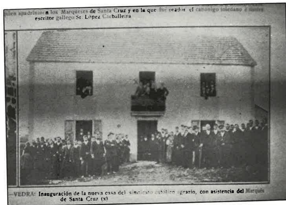
Fotografía 2. Inauguración do local social do SAC de Vedra, con asistencia do Marqués de Santa Cruz.

conflictivo verán de 1919, baixo o goberno de Maura (CASTILLO, 1976, 201 e 213).