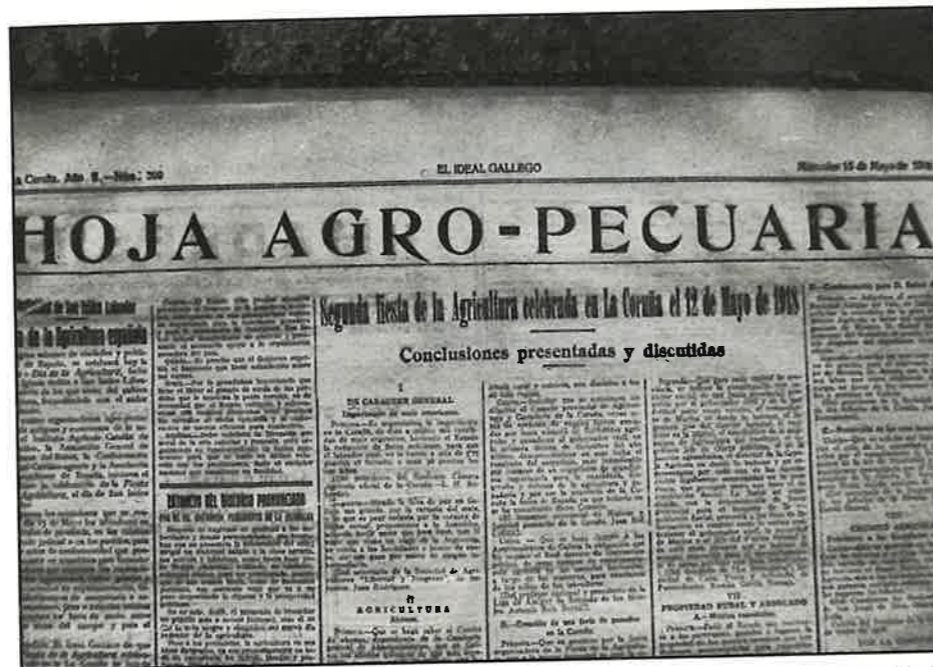
Fotografía 1. «Hoja Agropecuaria», logo denominada «Galicia Agropecuaria», suplemento do diario coruñés El Ideal Gallego .