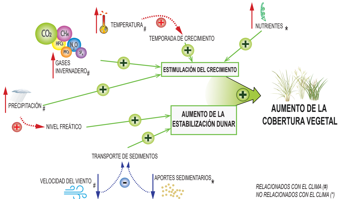
Figura 2: Diagrama de las relaciones habituales entre factores que pueden controlar el crecimiento de la vegetación dunar. Cabe destacar que el impacto de estos efectos combinados puede ser mayor que la suma de las contribuciones individuales. Modificada de Jackson et al. (2019).

las dunas costeras, tanto por atrapar la arena como por proteger sus depósitos de la erosión. Sin embargo, otros parámetros ya comentados con anterioridad (clima, topografía, sedimento) tienen el potencial de alterar los patrones de crecimiento de la vegetación (Fig. 2). Las características de las plantas (por ejemplo, la longitud y la anchura de las hojas o su capacidad de enraizar) son importantes en el inicio de una duna, y su interacción con la arena que se transporta hacia el interior desde la playa es muy variable (Innocenti et al. , 2021; McGuirk et al. , 2022). Cuando las dunas costeras están parcialmente vegetadas, se desarrolla un complejo sistema de retroalimentación positiva entre el tipo de vegetación, el flujo de arena y la morfología de las dunas (Hesp, 2011; Durán y Moore, 2013). Las dunas cubiertas de vegetación pueden estabilizarse y dejar de migrar, pero también