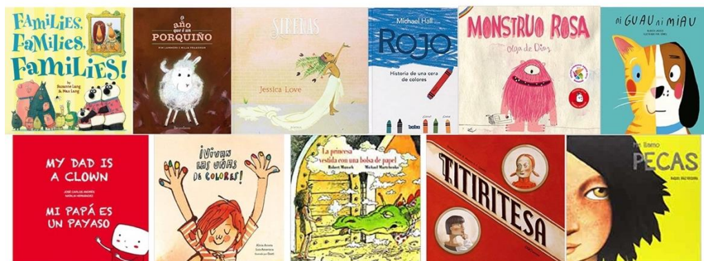
Fig.1 Álbumes ilustrados seleccionados. Fotografía das portadas.

A idea de base é que estes audiocontos pasasen a formar parte dos materiais do proxecto Bibliodiversidade de cara a fomentar e facilitar a integración da educación en diversidade afectiva-sexual nas aulas de infantil.