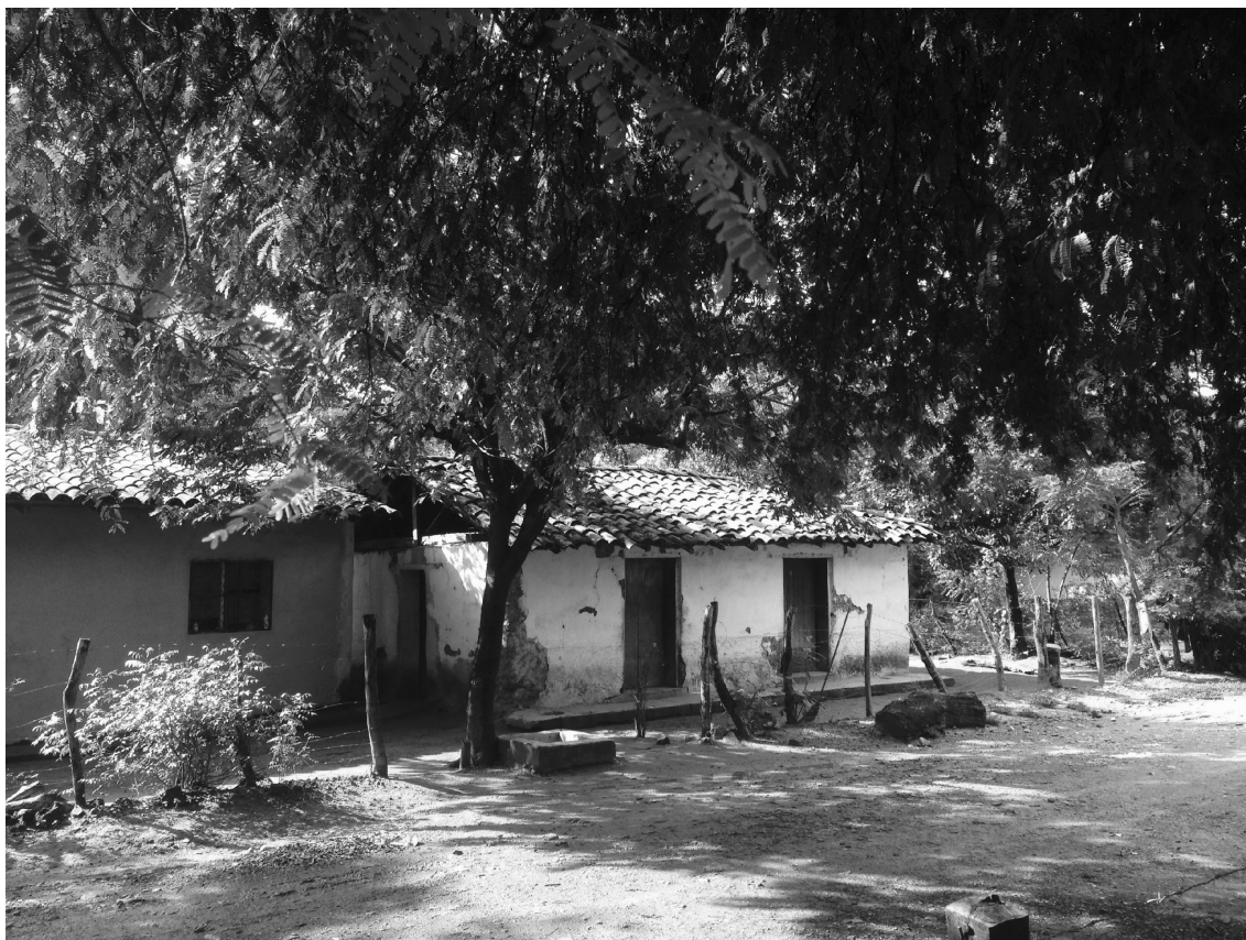
Imagen 1. Vista de la calle desde la entrada a la parcela. Obsérvese el aspecto que tienen las casas tradicionales

La zona donde se ubica la casa tiene el aspecto propio del rural en el bosque tropical seco, y hay bastante arbolado que da sombra. La Imagen 1, una fotografía de la vista desde la entrada a la parcela, puede ayudar a dar una idea del aspecto que tiene la zona.