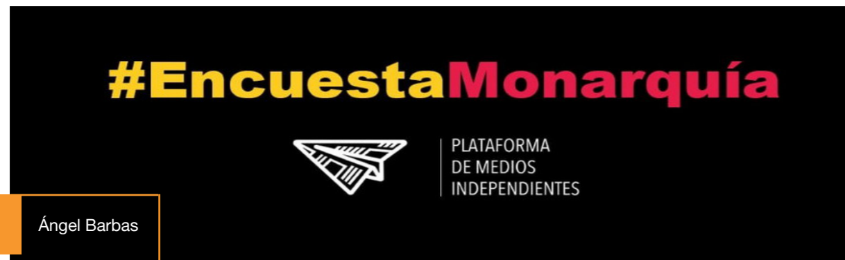
Banner utilizado por la Plataforma de Medios Independientes para promocionar el micromecenazgo para realizar una encuesta sobre aceptación de la monarquía.

La Plataforma de Medios Independientes fue creada en el año 2020 con el objetivo de defender los intereses de un conjunto de medios que se caracterizan por un sistema de financiación basado en las aportaciones de los suscriptores y por su compromiso con la independencia periodística. La primera acción conjunta de este grupo de medios estuvo motivada por las noticias que apuntaban que el Gobierno estaba estudiando medidas para apoyar a los medios de comunicación; y se concretó en una petición para que el Gobierno tomara tres medidas básicas destinadas a “proteger la pluralidad y la calidad de la información, así como la sostenibilidad de los medios que dependen de sus lectores”. Estas eran: