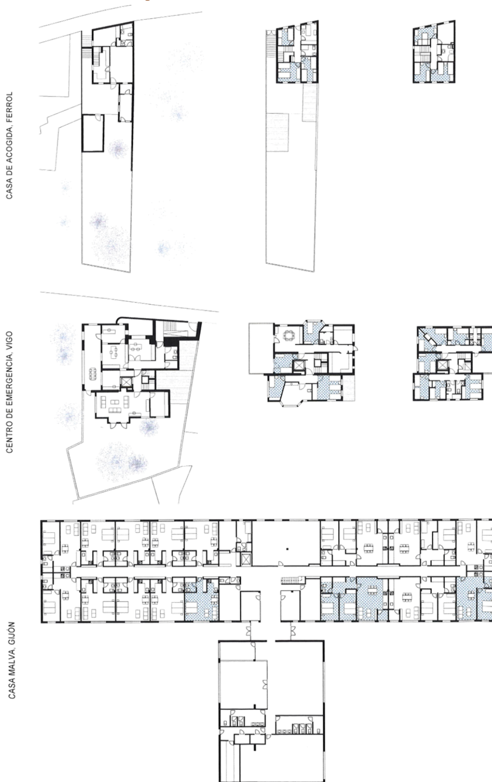
Figura 4. Plantas de los casos de estudio