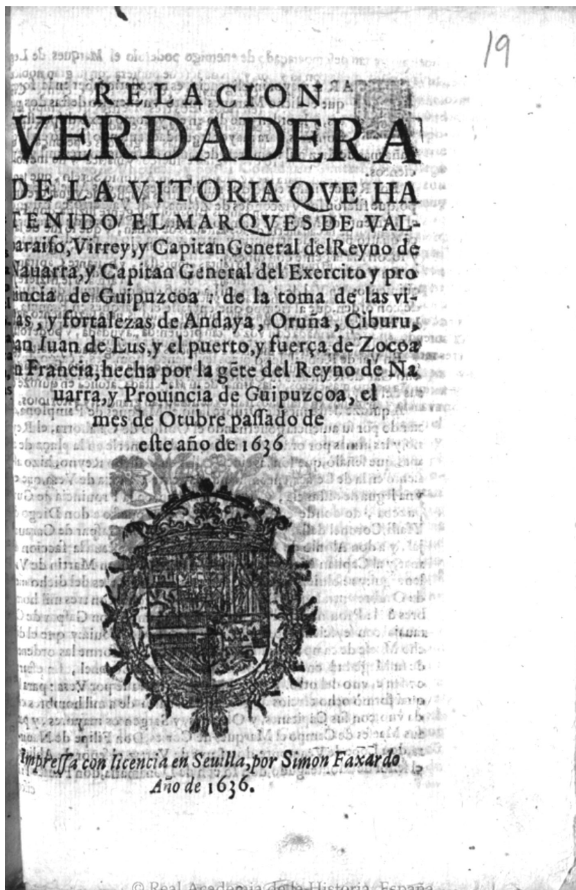
Figura 3. Relacion verdadera de la victoria... En Sevilla, por Simon Faxardo