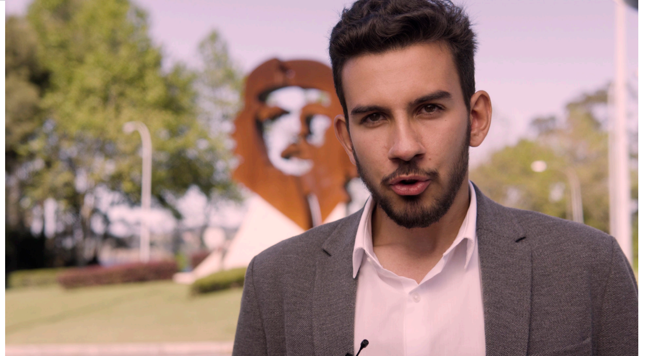
Imaxes proceso corrección de cor