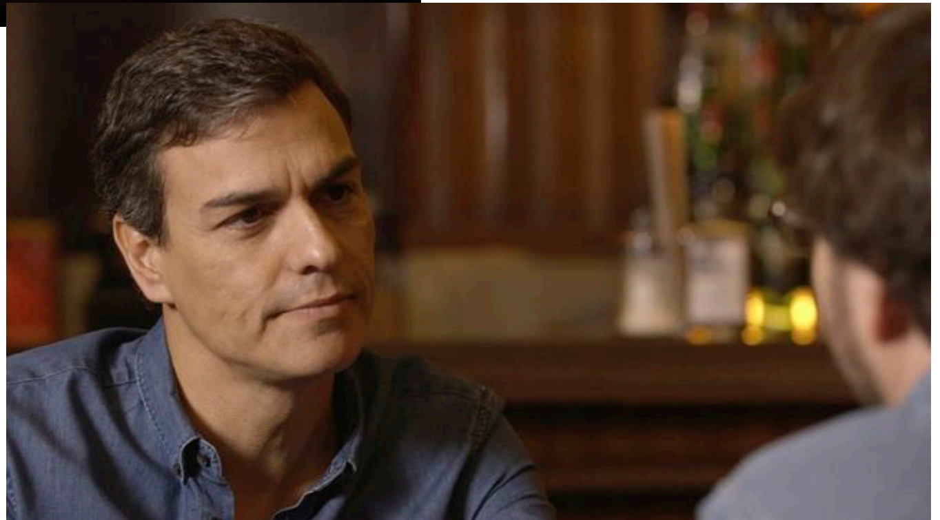
PLANOS DE REFERENCIA DE "SALVADOS"