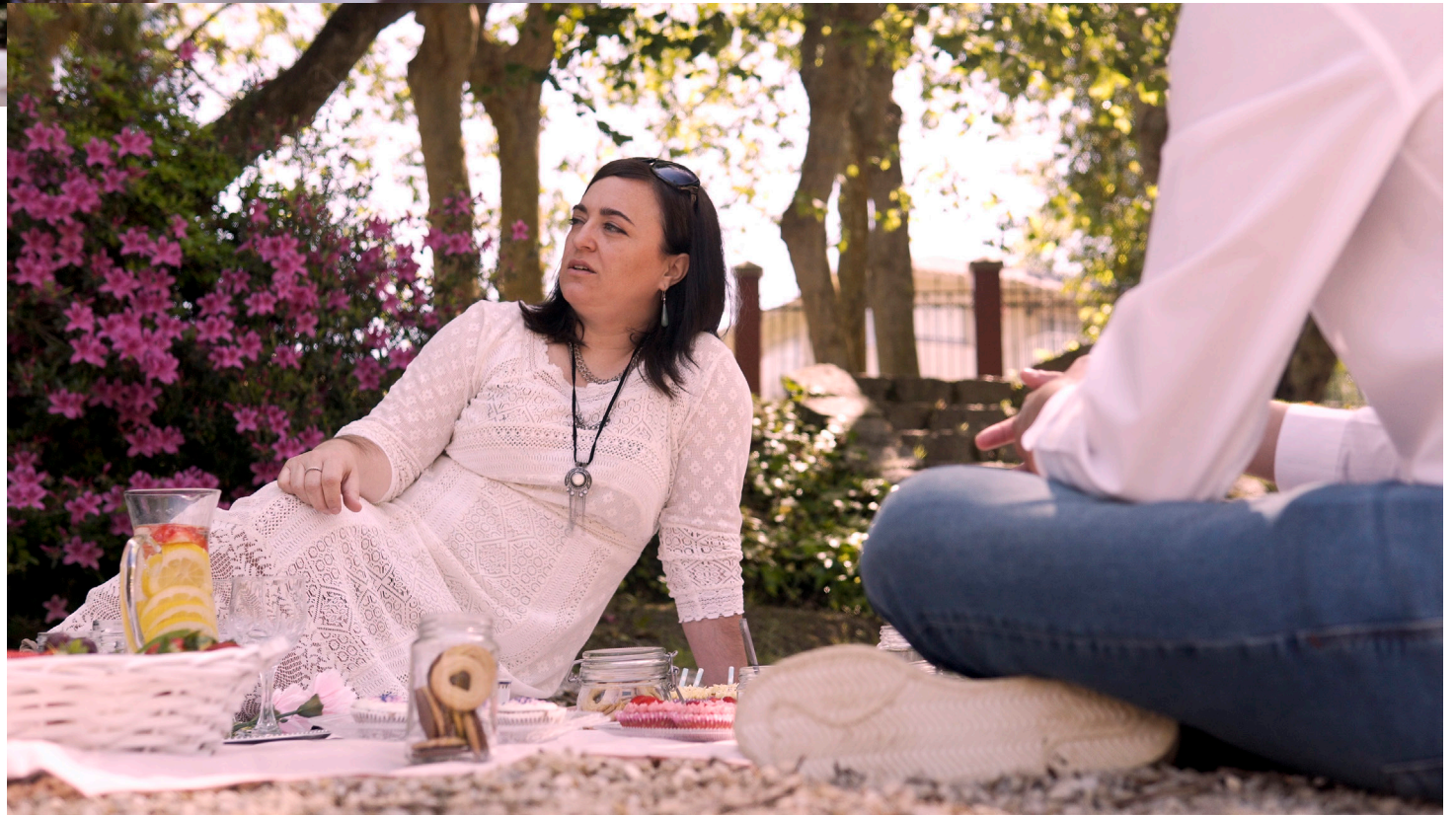
PLANOS DE “VILANOVA DE CASTRO”