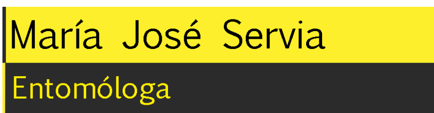
Exemplo de rótulo

A tipografía ten unha cor negra sobre fondo amarelo na parte superior do rótulo e amarela sobre fondo negro na parte inferior. Eliximos poñer fondo aos rótulos para axudar a que se apreciara ben na pantalla. Diminuímos a opacidade do fondo para que o rótulo se integrase mellor na imaxe.