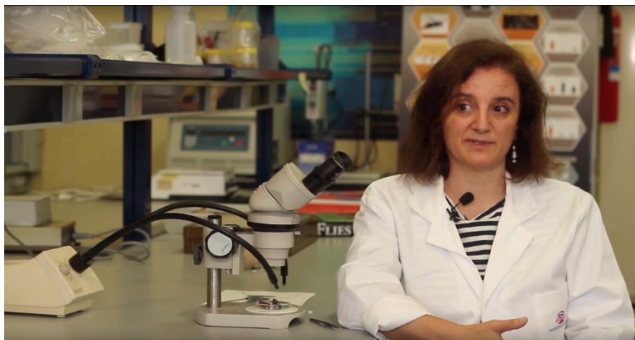
Imaxe sen editar

Tamén decidimos darlle un estilo máis cinematográfico engadindo franxas negras arriba e abaixo da imaxe.