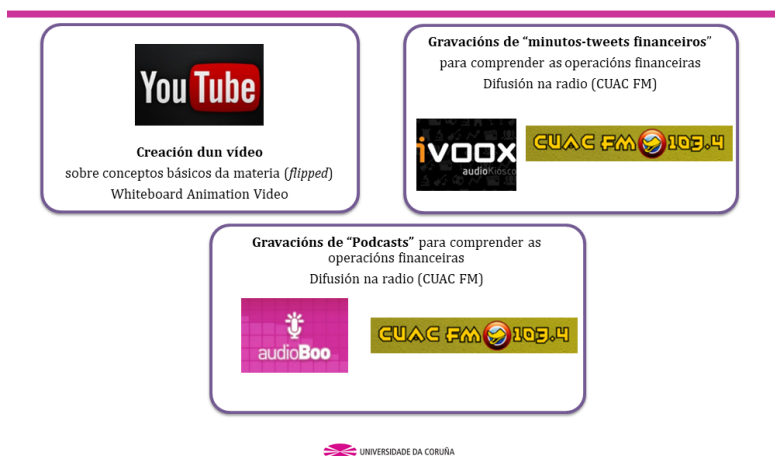
Figura 4. Produtos educativos resultantes

Unha vez creados os produtos, estes servirán para formar ao grupo de clase da materia “Expresión corporal e adaptacións curriculares” por parte do alumnado de “Análise das Operacións Financeiras”. Deste xeito o alumnado de finanzas, unha vez asimiladas as competencias e os contidos, forman nos conceptos básicos en operacións financeiras ao alumnado do grao en Educación –entre iguais-.