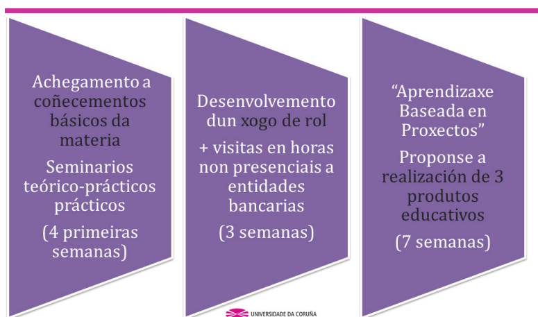
Figura 3. Desenvolvemento da proposta

preparan ao “actor/actriz” cliente/a deben buscar as preguntas a levar a cabo e a información necesaria doutras entidades competidoras (os outros dous grupos) á que representa o “actor/actriz” director/a. Estas preguntas están encamiñadas a conseguir un bo financiamento, unha boa oferta por parte da entidade financeira. Doutra banda, os grupos que preparan ao “actor/actriz” director/a deben preparalo/a para poder responder a todas as preguntas que lle vai facer un/ha cliente/a preparado/a. Ao mesmo tempo os dous “actores/actrices” deben levar pensado ou preparado tamén a súa estratexia a seguir, en función da resposta que lle dea a contra-parte. A fin última é tentar chegar a un acordo co que estean contentas as dúas partes negociadoras. Neste momento aproveitárase para visitar algunha entidade financeira cada grupo e poder achegarse ao contexto real dunha oficina deste tipo (Figura 3).