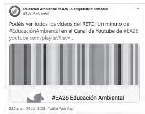
Ilustración 6: Pantallazo de Twitter informando do canle de Youtube #EA26.

Iníciase cun primeiro contacto a través de Twitter onde se intercambian tweets coa Ministra de Transición Ecolóxica. Este encontro casual derivou na proposta de reunión no Ministerio para a seguinte semana. A través de WhatsApp , defínese o grupo de persoas que van á reunión e paralelamente en Drive vaise construíndo un documento colaborativo coas achegas do equipo de