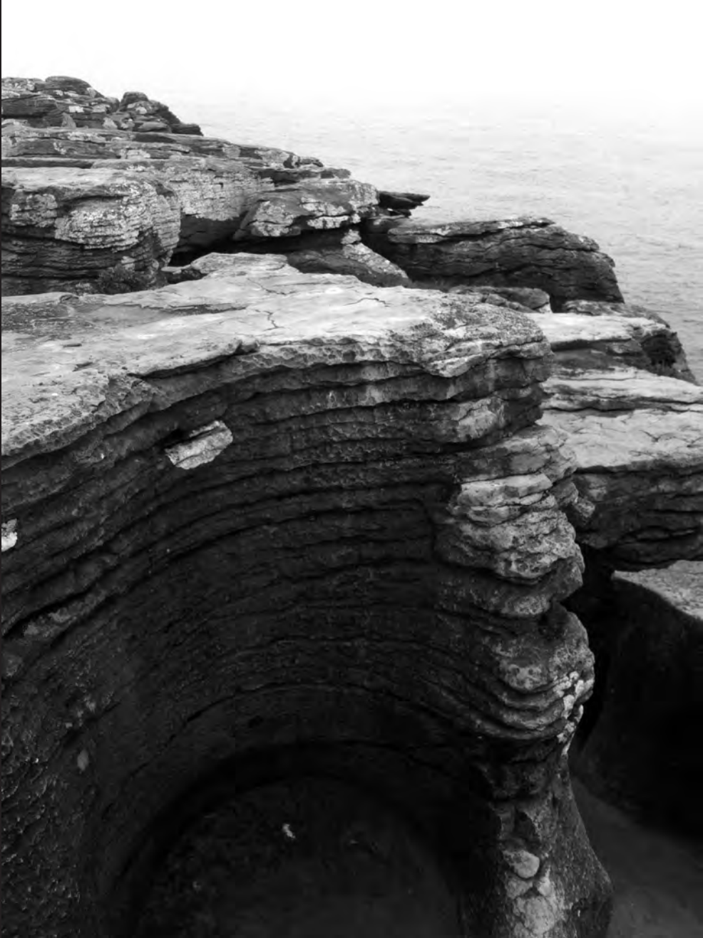
Rede Natura do Oeste. Cabo Carvoeiro-Peniche (Portugal)