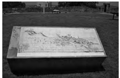
Imaxe 7: Debuxo da cidade reproducido en azulexo, dentro desta actuación, e situado no Castelo de San Sebastián. “Vista de la villa de Vigo” de 1667. (España, Ministerio de Educación Cultura e Deporte. Arquivo Xeral de Simancas. MPD08069).