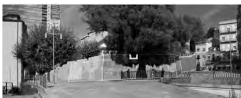
Imaxe 16. Panel que mostra outra das estratexias para suplir a falta de imaxes como é a de reconstruír a traza da muralla sobre a foto da cidade actual