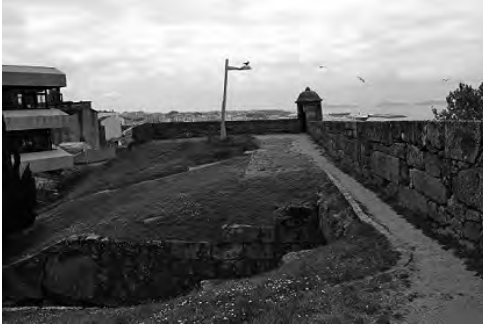
Imaxen- 2 Castelo de San Sebastián, interior onde hoxe se atopa a casa do concello, a esquerda.

de 147 m. de altura, en cuxas abas Norte e Leste se desenvolveu a cidade desde época medieval e por onde descorría a muralla. Esta fortaleza, conservada en boa parte, hoxe queda no centro urbano, facendo parte dun parque público, un lugar de paseo para a veciñanza e un punto de visita obrigado para turistas polas súas impresionantes vistas sobre a cidade e sobre a ría de Vigo, tal e como recollen as guías de visita e rutas de paseo pola cidade. No entanto, coa desaparición da muralla esqueceuse a súa memoria e o vencello co castelo do Castro.