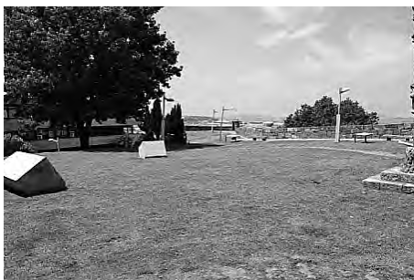
Imaxe 11. Vista xeral da situación dos murais en azulexo e paneis no Castelo de San Sebastián, e onde se aprecia parte da panorámica sobre a cidade. No fondo a esquerda o edificio municipal

Nos catro puntos restantes colocáronse 5 paneis interpretativos de diferentes momentos históricos da construción e uso da muralla.