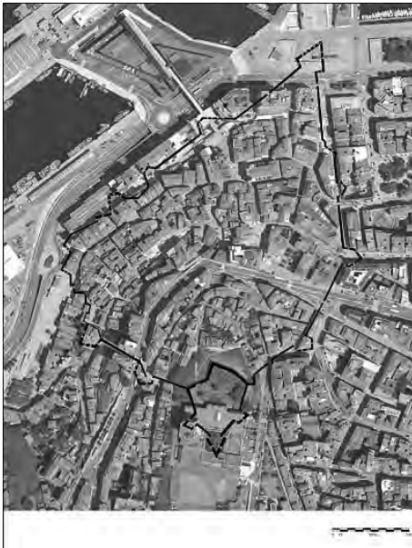
Imaxen 6: Trazado da muralla sobre a cidade actual. Proposta feita a partir da análise dos diferentes planos e dos puntos onde as escavacións descubriron alicerces.