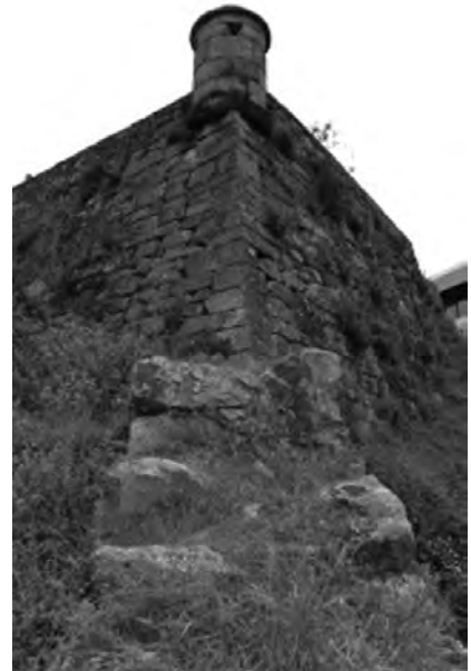
Imaxen 3 Exterior. Semibaluarte onde entronca coa pequena porción de muralla conservada

Entre a veciñanza a muralla é coñecida principalmente pola loita contra a ocupación francesa da cidade en 1809. A manobra