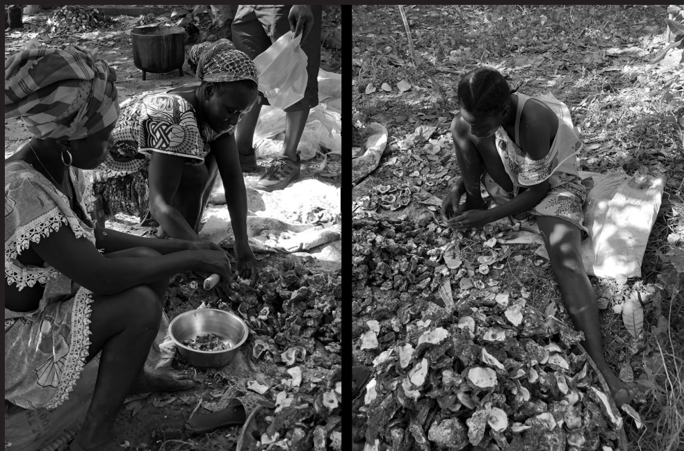
Processo artesanal de descascamento de ostras para secagem. Guiné Bissau