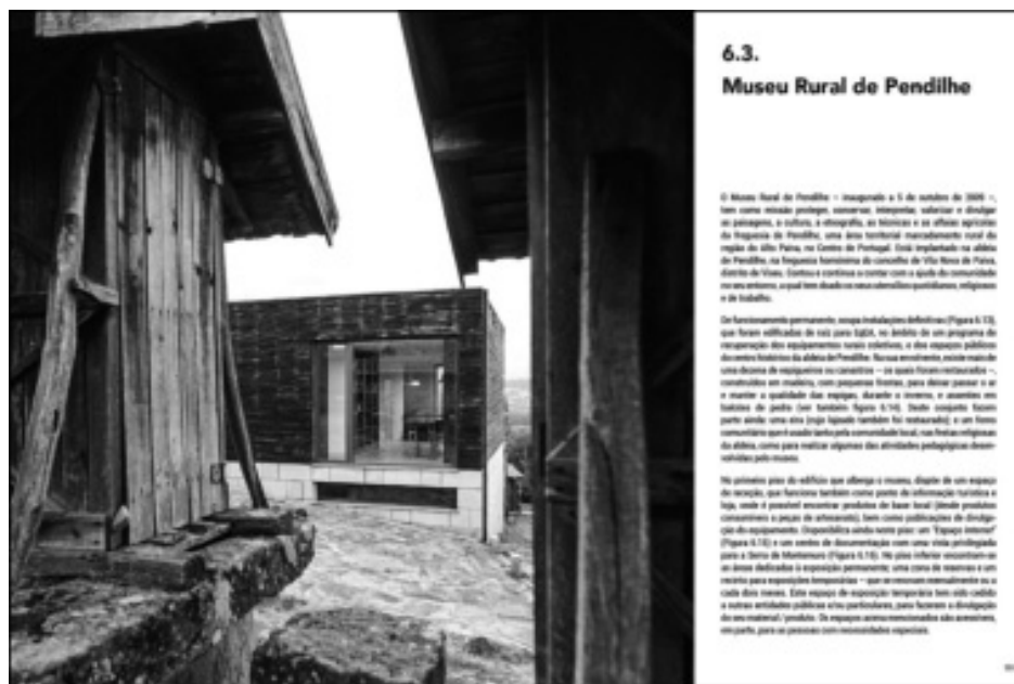
Figura 2: Início de subcapítulo para apresentação de um equipamento (a cores no original; CORREIA MARQUES et al., 2018:150-151).

ciência”: Plataforma de Ciência Aberta, Centro de Ciência de Vila Real, Centro Ciência Viva de Bragança”; do capítulo 4 “O presente do passado”: Museu do Cão, Museu do Quartzo, Casa das Pedras Parideiras; do capítulo 5 “Produtos desvelando territórios”: Museu do Douro, Núcleo Museológico de Faveiros – Pão e Vinho, Museu do Vinho de São João da Pesqueira, Museu do Pão; do capítulo 6 “Interpretando o património”: Centro de Interpretação e Informação do Montemuro e Paiva, Centro Pedagógico e Interpretativo da Rede Natura de Lamosa, Museu Rural de Pendilhe (ver Figura 2); e, por fim, do capítulo 7 “Atividades no Parque”: Parque Botânico Arbutus do Demo, Parque Biológico de Vinhais, Passadiços do Paiva. Para a presente obra, não se revelou