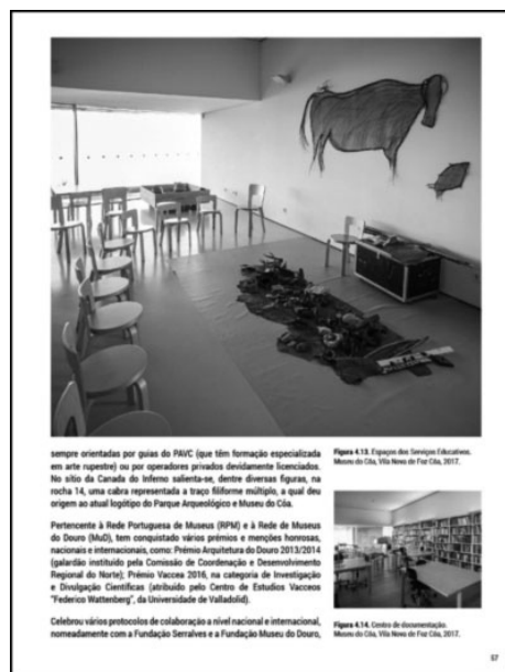
sempre orientadas por quem do PIVC (que têm formação especializada em arte registre) ou por operadores privados devidamente licenciados. No sítio do Canal do Inferno salienta-se, dentre diversas figuras, na noite 14, uma cubra representada a traço trifórmio múltiplo, o qual deu origem ao atual logótipo do Parque Arqueológico e Museu do Cão.

Importa referir que nestes EqEA, conciliar, de forma integrada, a vertente da EA com outras vertentes socioeconómicas, se revela muito positiva, tanto no aumento da multiplicidade de segmentos da comunidade local que envolvem, como na maior capacidade para atrair visitantes/utilizadores e, em consequência, no gerar de riqueza e emprego. Este facto