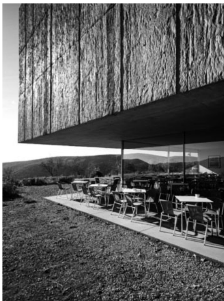
Figura 5: Esplanada do restaurante do Museu do Côa (a cores no original; CORREIA MARQUES et al., 2018:59)

Em paralelo, estão a procurar construir redes eficazes e inteligentes, e/ou fortalecer conexões sinérgicas entre si, bem como entre este tipo de recursos de EA e os agentes ambientais, sociais e económicos. A título exemplificativo, refira-se as visitas conjuntas já disponíveis, com aquisição de um só ingresso de entrada, como: Museu do Douro, Museu do Côa e Museu de Serralves; Museu do Côa e Museu da Casa Grande de Numão de Freixo.