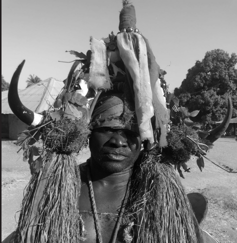
Tabanca de Bijante. Guiné Bissau