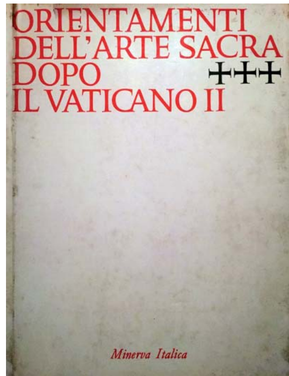
Fig. 02. Portada del libro editado por Giovanni Fallani Orientamenti dell'arte sacra dopo il Vaticano II (1969).

Su opinión era la de descartar las imitaciones estilísticas, aunque la desnudez arquitectónica a menudo, para él, había conducido a ejemplos no lo bastante solemnes.