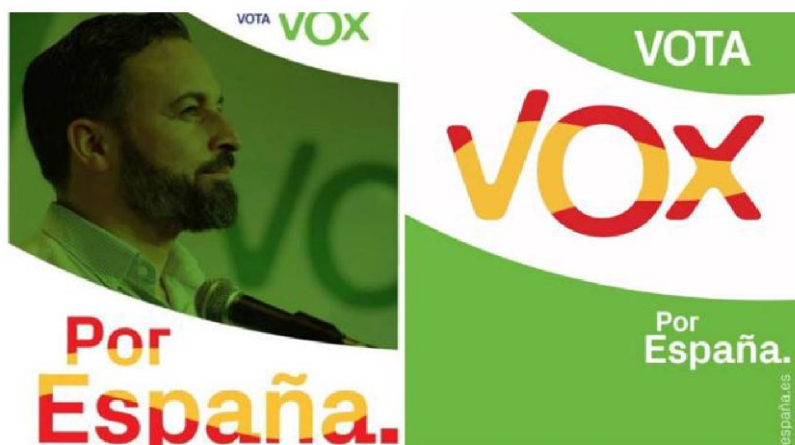
Figura 6. Cartel oficial de VOX

El propio nombre del partido es en sí mismo un acierto desde el punto de vista de la creación de marca y la identidad corporativa. Es sencillo, directo, fácil de recordar y muy alegórico. No es unas siglas, ni una palabra en castellano sino un término procedente del latín que se traduce literalmente por voz. De ahí la importancia de la selección de la imagen, su líder frente al micrófono que va a permitir que su mensaje se difunda y llegue a todos los rincones. La elección y combinación de los colores no es casual. Por una parte, el cartel se divide de forma simétrica en dos banderas que actúan cual positivo-negativo y juegan a ser una bandera que ondea al aire con los colores corporativos de Vox que aquí recuerdan a la bandera Andaluza primer territorio, electoralmente hablando, ganado. El espacio ocupado por cada una de las franjas coincide en grosor con el doble ancho de la banda amarilla central de la bandera patria y además al darle efecto de movimiento simula ondear al viento.