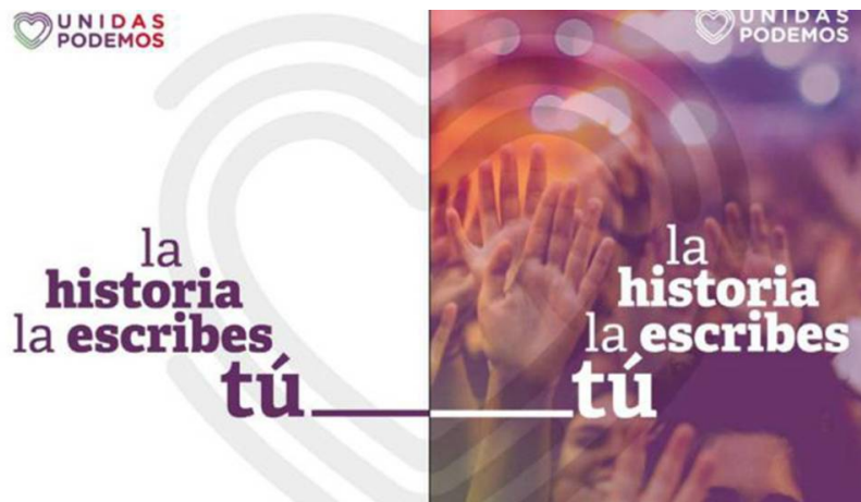
Figura 4. Cartel oficial de Unidas Podemos (fuente: Unidas Podemos)

Es significativo también, que la imagen elegida esté desenfocada. Esta decisión puede estar relacionada con el intento de evitar polémicas aludido antes, pero entendemos que responde mejor a la idea de anonimizar a la gente y las personas, que no el pueblo, como el conjunto de la ciudadanía que es la verdadera protagonista de las políticas del partido. Esto se ve reforzado por la presencia del eslogan, “la historia la escribes tú”, que definitivamente borra cualquier veleidad de protagonismo que se les pudiera atribuir a los líderes del partido.