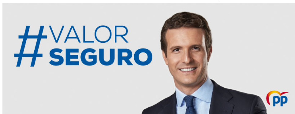
Figura 2. Cartel oficial del PP

atención. Un rostro con una amplia sonrisa en la que se muestran los dientes y que connota felicidad y sirve para provocar respuestas positivas en las personas que nos miran. Una sonrisa que intenta parecer natural y sincera pero que muestra cierta tensión en el mentón, fruto de lo artificioso de las sesiones fotográficas a las que deben someterse los políticos antes de las elecciones. Es el único que muestra la corbata de manera clara y presenta una imagen impecable, retocada en exceso y libre de cualquier imperfección en rostro y dientes. Muestra al hijo perfecto, al padre perfecto, al marido perfecto al presidente perfecto, un auténtico valor seguro a pesar de su juventud y falta de experiencia.