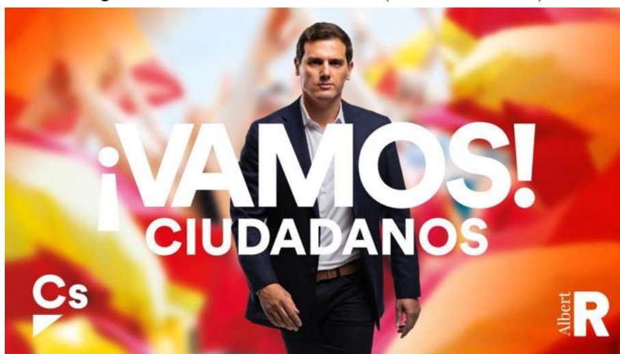
Figura 3. Cartel oficial de Ciudadanos

Los elementos de identidad corporativa muestran la evolución de la marca en un claro intento por demostrar modernidad frente al resto de opciones conservadoras con las que compete a la hora de captar votos (PP y Vox) en un claro intento de convertirse en el líder de los partidos del centro-derecha. También en la pegada de carteles se demuestra esa apuesta por la modernidad y la acción y hacen una pegada de carteles digitales con “efectos especiales” incluidos 4 . Todo el acto pone de relieve dos realidades