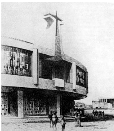
Fig. 02. Pedro Ramírez Vázquez et al., Nueva basílica de Nuestra Señora de Guadalupe, Ciudad de México, 1972/75.