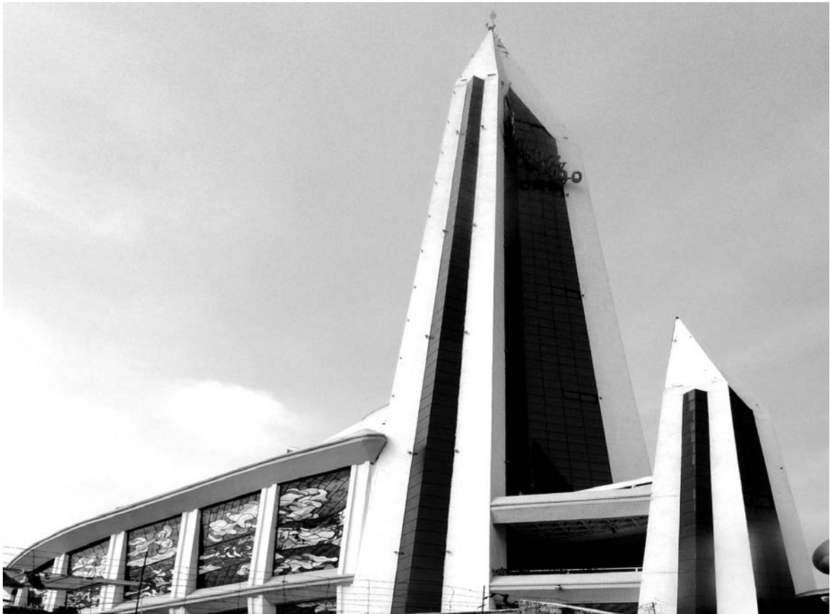
Fig. 05. Templo de la Luz del Mundo, Ciudad de México, 2000; cubierta.

once templos regionales más, sobre todo en aquellas ciudades donde se ha registrado una importante actividad mormona. El gran templo de la Ciudad de México es el de mayor tamaño fuera de los Estados Unidos (Fig. 05). Se encuentra localizado en el barrio de San Juan de Aragón, al oriente de la capital 7 . Su construcción fue anunciada en abril de 1976, aunque sólo se terminó siete años después. Fue dedicado en 1983 8 .