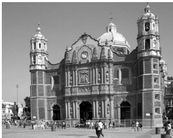
Fig. 01. Basílica de Guadalupe, antigua población de La Villa, s. XVIII.