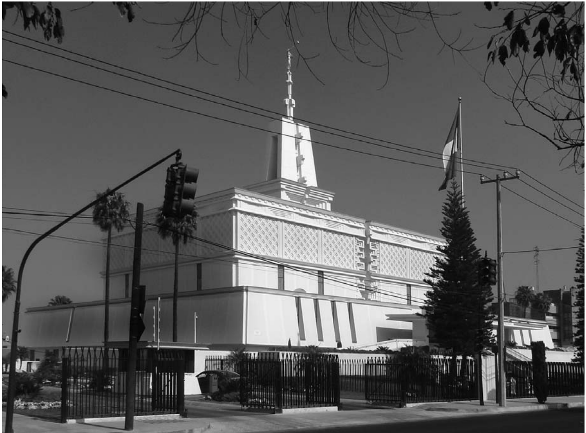
Fig. 06. Gran templo Mormón, Ciudad de México, 1976/83.

en su zona urbana, lo que la convierte en la segunda ciudad más poblada después del Valle de México, donde se asienta la capital federal.