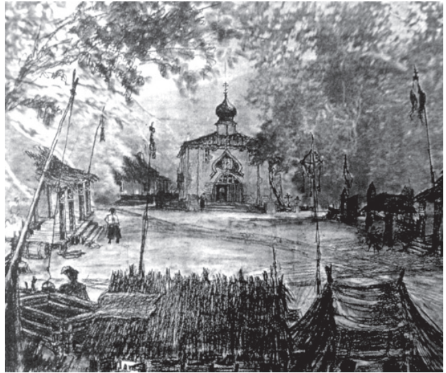
Fig. 1. Alexander Toluboff, boceto para The Cossacks , 1928.

ser excelentes dobles cuando se exigían habilidades de equitación, ya fuese para hacer de legionarios romanos o de indios americanos. También hubo unos pocos intelectuales y aristócratas rusos que fueron a Hollywood. Afortunadamente pudieron obtener empleo como consultores para una película sobre su exótico país que había dejado de existir hacía quince años.