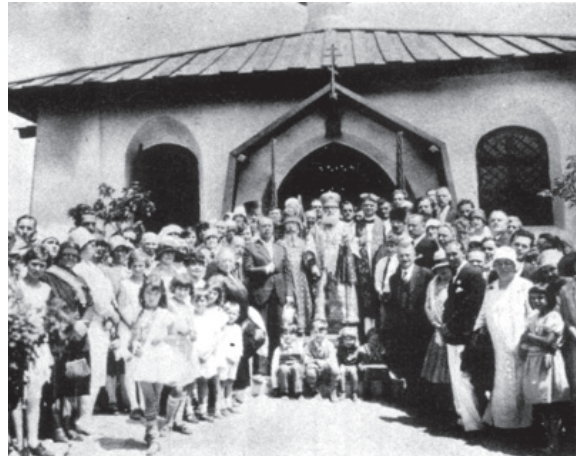
Fig. 4. iglesia de Santa María Virgen, Los Ángeles. Consagración de la iglesia.

papel del general ruso lo represente un actor alemán, Emil Jannings. Simultáneamente, los verdaderos oficiales de alto rango del ejército blanco permanecían sobre el telón de fondo o detrás de la pantalla. Stenberg escribe en sus recuerdos de la película que le fue difícil persuadir a los consultores rusos de que ocultasen su desdén por la manera en la que los extranjeros representaban a su país. Sin embargo, al final la película fue aceptada por la comunidad rusa como un éxito. Esta obra de un gran cineasta, The Last Command , contiene escenas que incluso ahora, ochenta años después de su producción, siguen siendo conmovedoras. Aunque no sea totalmente auténtica, la película toca todas las cuerdas del alma de los emigrantes que siguen enfrentándose a la pérdida de su patria y de su identidad.