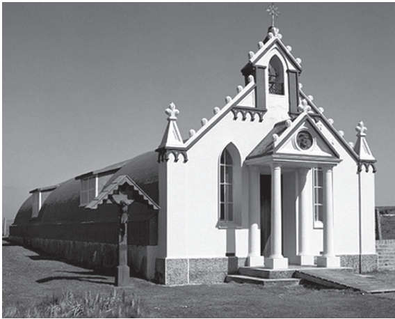
Fig. 5. Capilla italiana, Orkney, Escocia, h. 1943.

ensayo de Baudrillard. No obstante, Ricoeur argumenta que más que un invento siniestro de la economía capitalista, la ideología es un atributo más general del mundo contemporáneo. Para lograr ofuscar la desigualdad económica, una ideología debe también abrazar aquellas percepciones de la realidad que son de naturaleza puramente racional. Además, las ideologías proporcionan un fin a los miembros de la sociedad y les inspiran en su búsqueda de sentido vital. La ideología de la comunidad rusa de Hollywood en la década de 1920 era una mezcla compleja. Por una parte, fusionaba los propios intereses con las apasionadas convicciones políticas; por otra, los sueños de retorno con la necesidad de encontrar un sentido a las prácticas diarias; finalmente, la lucha por la excelencia con la voluntad de aceptar compromisos.